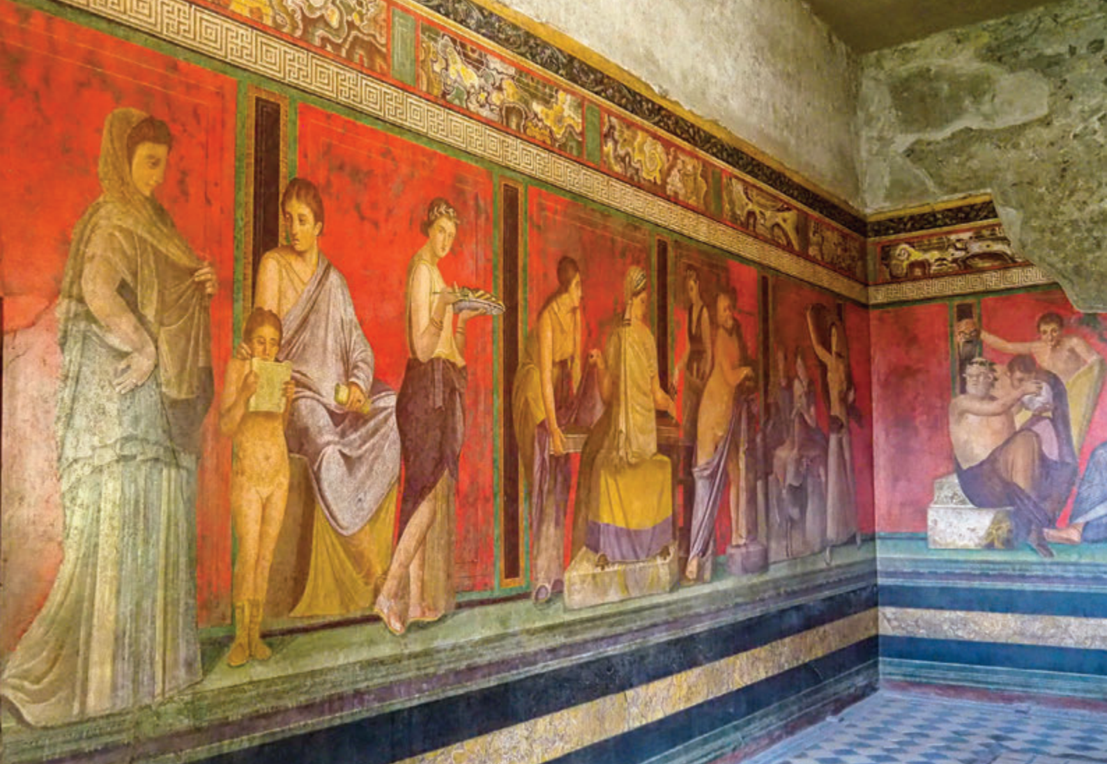
Villa de los Misterios, Fresco de iniciación dionisiaca

se reconstruyó un lagar donde se exprimía la uva, cuyo tronco remata en una cabeza de carnero. A lo largo de las paredes del triclinio se encuentra el gran fresco con las escenas de un rito de iniciación en los misterios dionisiacos (al que la villa debe su nombre), o bien, de la iniciación de la mujer en la vida de casada. En la pared se pueden admirar unos espléndidos motivos en miniatura contra un fondo negro, que se inspiran en la pintura egipcia.