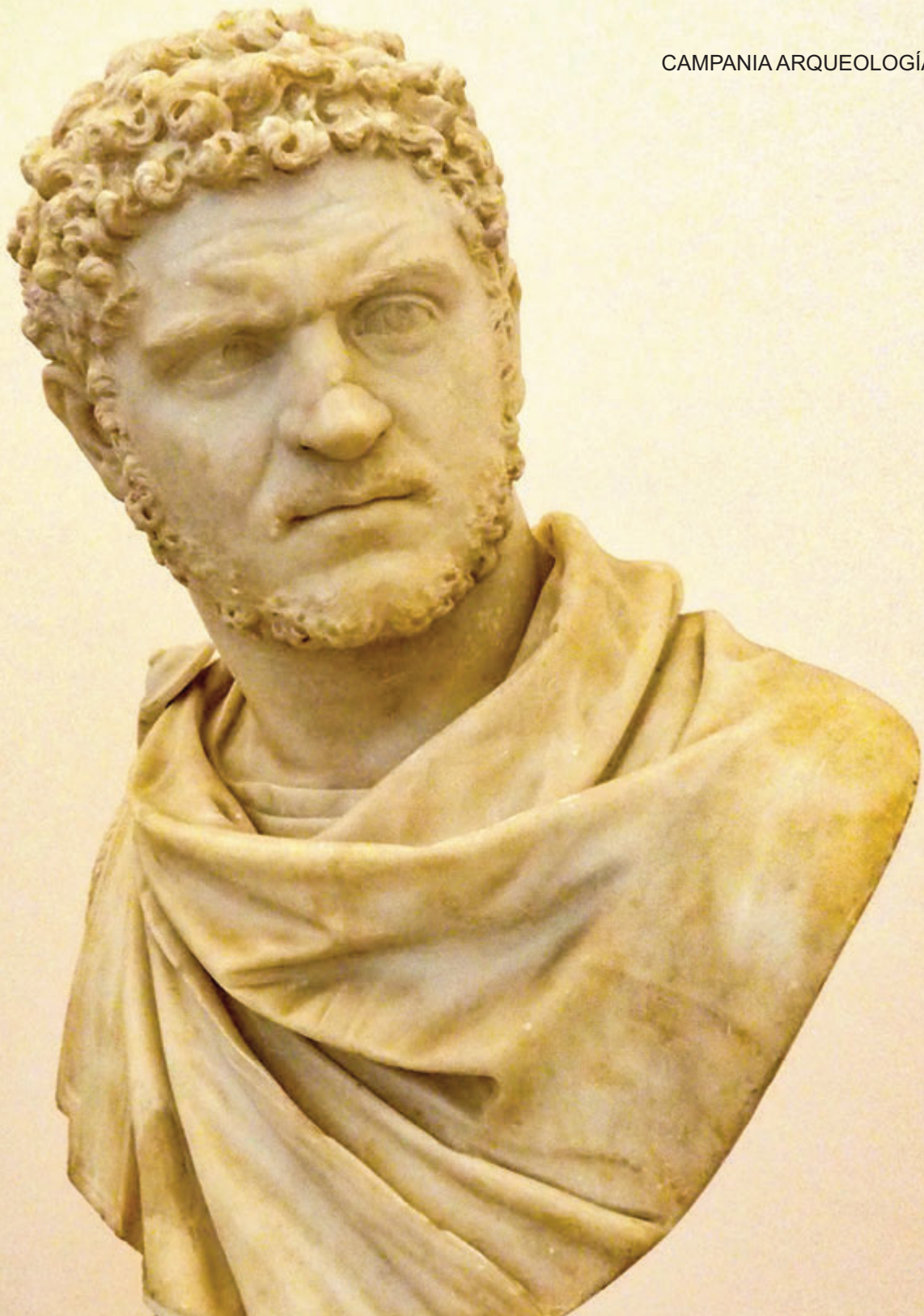
Busto del Emperador Caracalla

Secreto durante mucho tiempo no había sido posible visitar o contemplar las obras que se exponen en este espacio, todas ellas alegóricas al erotismo, con escenas de sexo, todas ellas encontradas mayormente en Pompeya incluso encontramos la reproducción de una de las habitaciones del “ lupanar ” o prostíbulo. Cabe