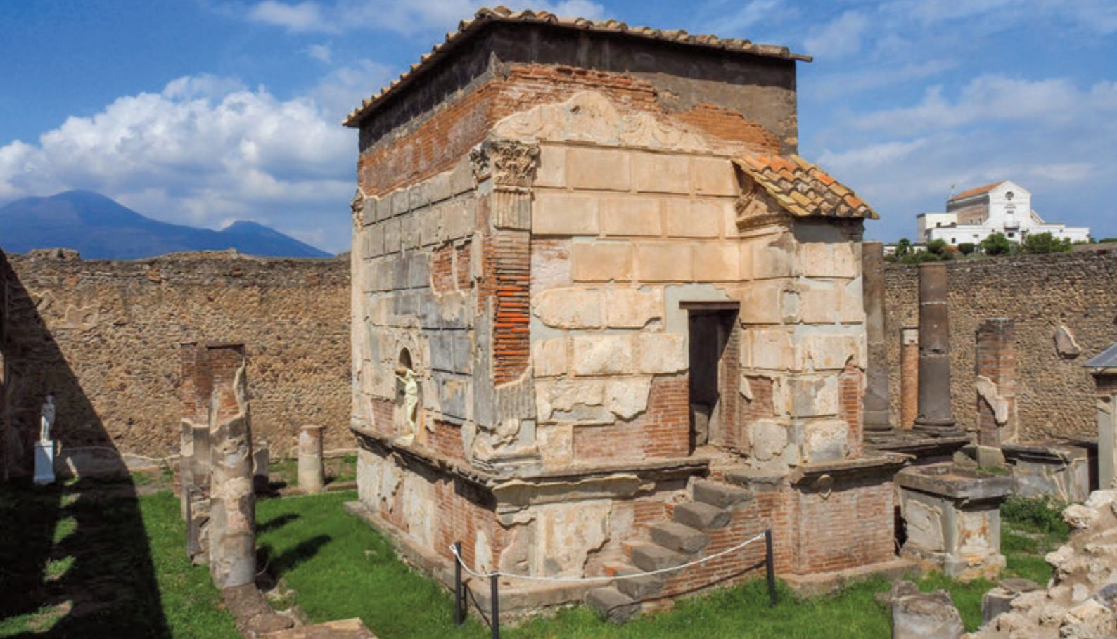
TEMPLO DE ISIS CON COLUMNAS CORINTIAS Y ESCULTURAS DE ANUBIS Y HARPÓKRATES