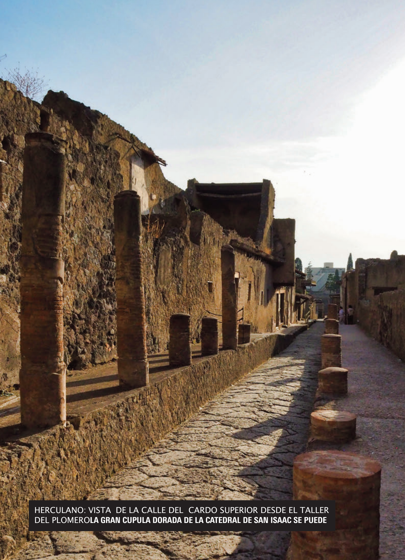
HERCULANO: VISTA DE LA CALLE DEL CARDO SUPERIOR DESDE EL TALLER DEL PLOMEROLA GRAN CUPULA DORADA DE LA CATEDRAL DE SAN ISAAC SE PUEDE