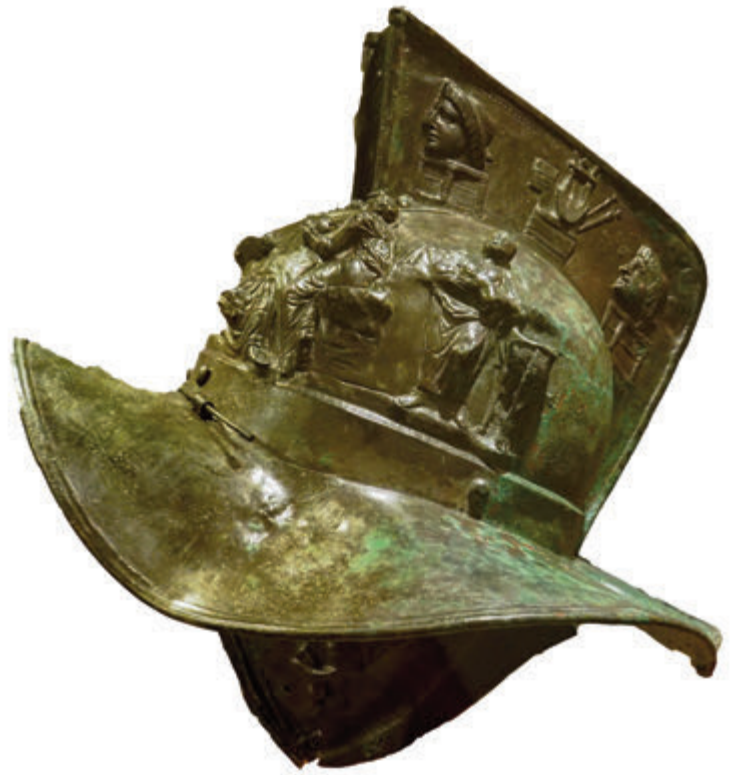
MOSAICO MEMENTO MORIS Y CASCO DE GLADIADOR- MOSAICO BAILARINAS DE RUFO