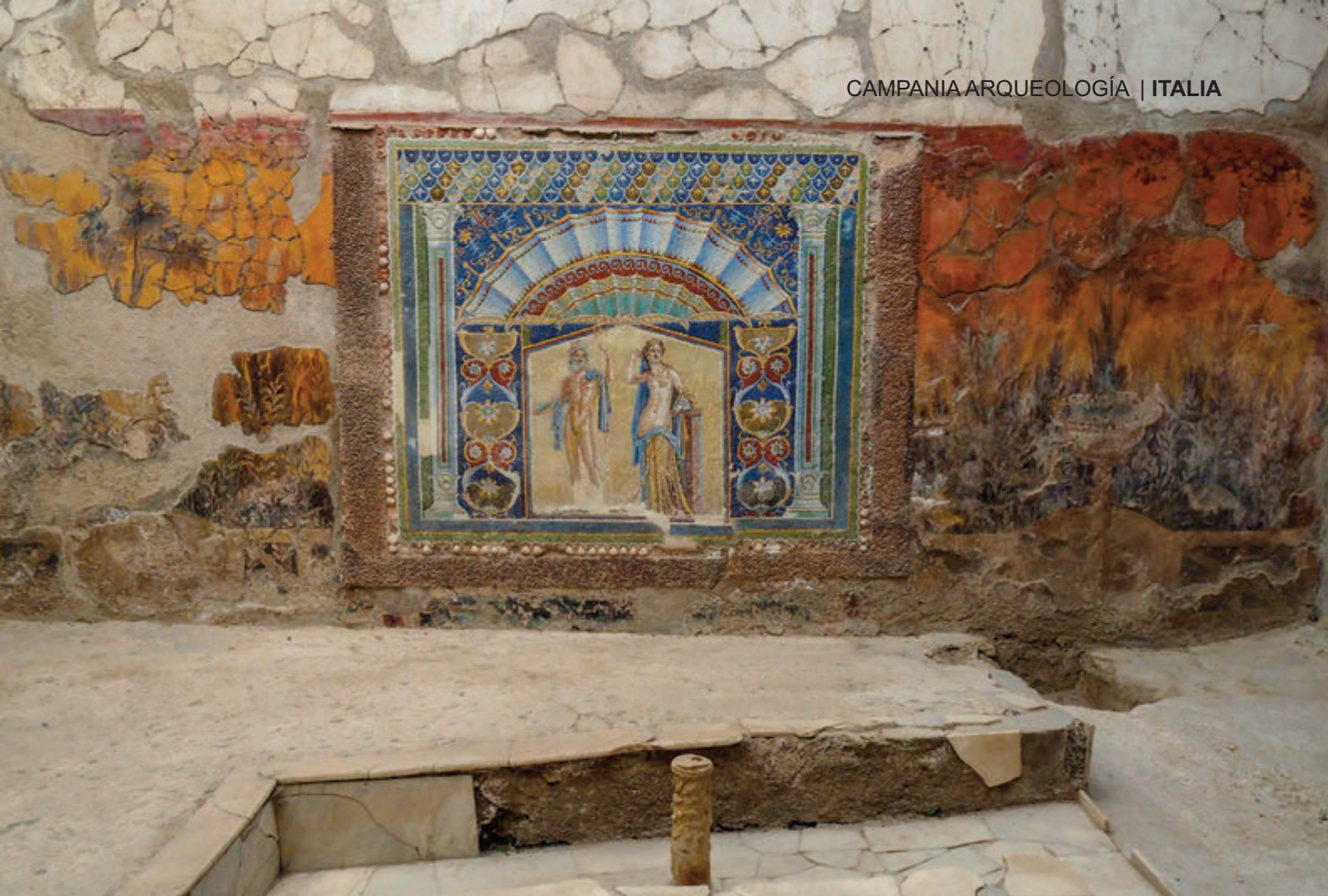
TRICLINIO DE LA CASA DE NEPTUNO Y ANFITRIE- INFERIOR GRAN TABERNA