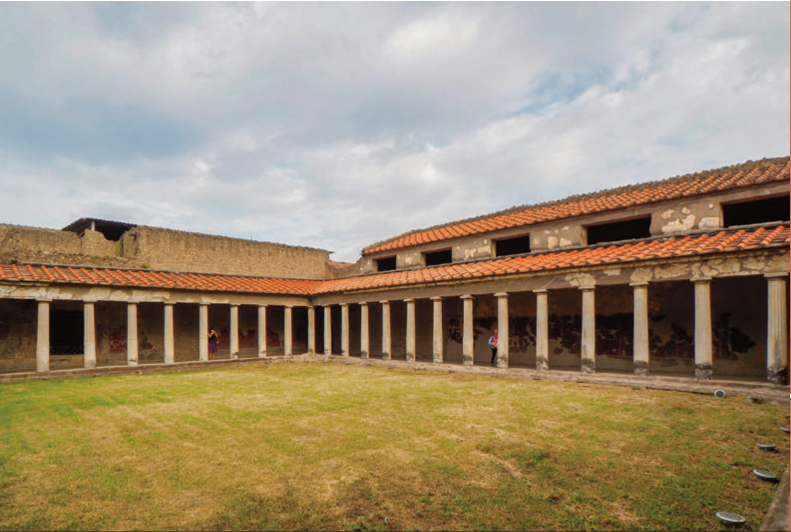
OPLONTIS :COLUMNATA DEL PERISTILO Y PERISTILO INTERIOR ZONA DE SERVICIO