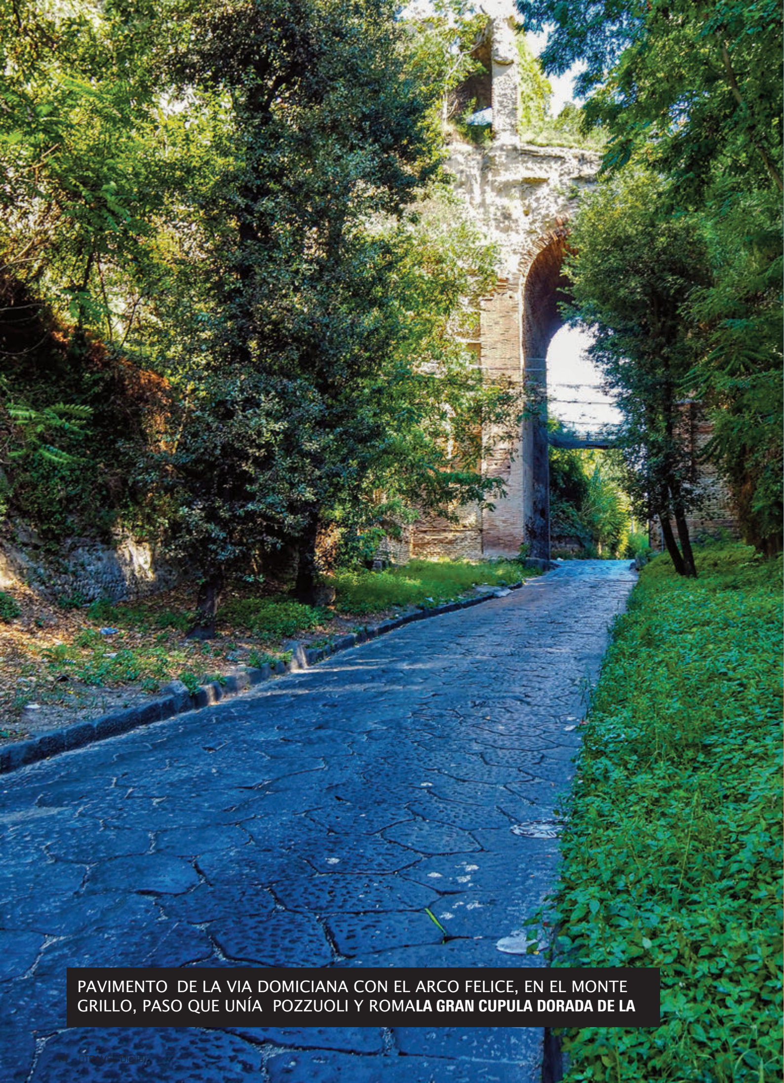
PAVIMENTO DE LA VIA DOMICIANA CON EL ARCO FELICE, EN EL MONTE GRILLO, PASO QUE UNÍA POZZUOLI Y ROMA LA GRAN CUPULA DORADA DE LA