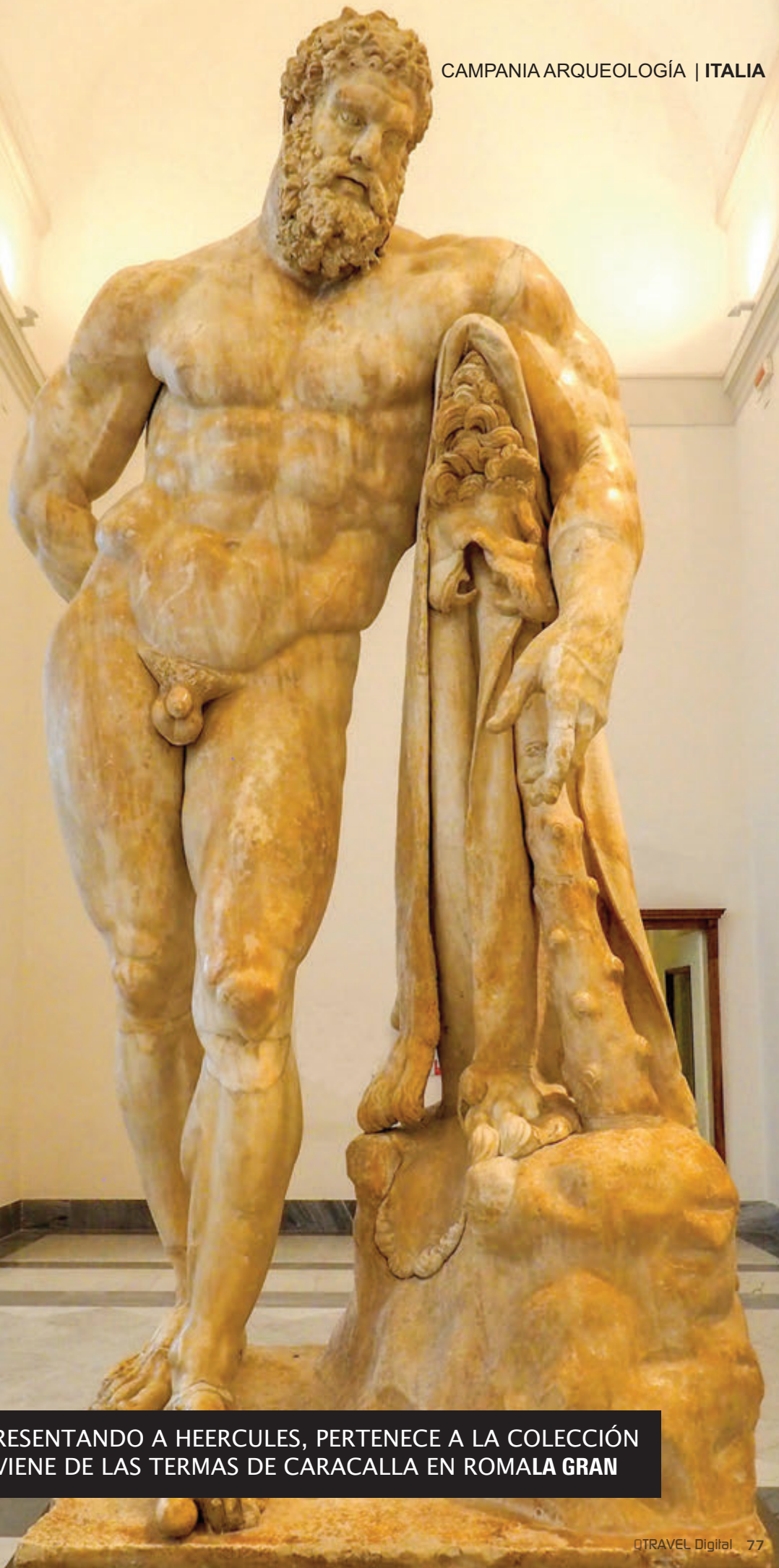
ESCULTURA REPRESENTANDO A HEERCULES, PERTENECE A LA COLECCIÓN FARNESIO Y PROVIENE DE LAS TERMAS DE CARACALLA EN ROMA LA GRAN