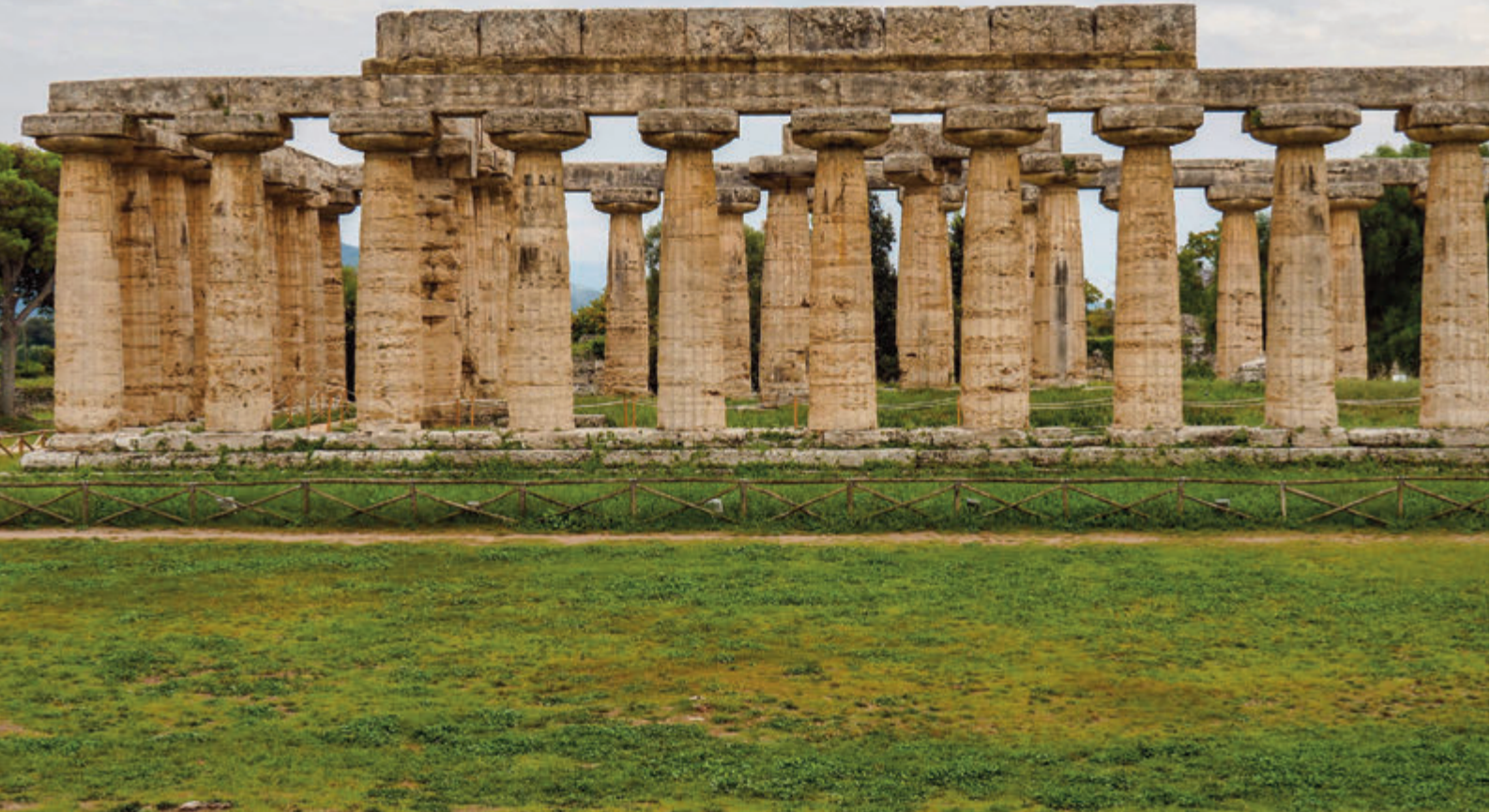
INTERIOR: IMPLUVIO DE MÁRMOL EN UNA CASA DE LA PORTA MARINA