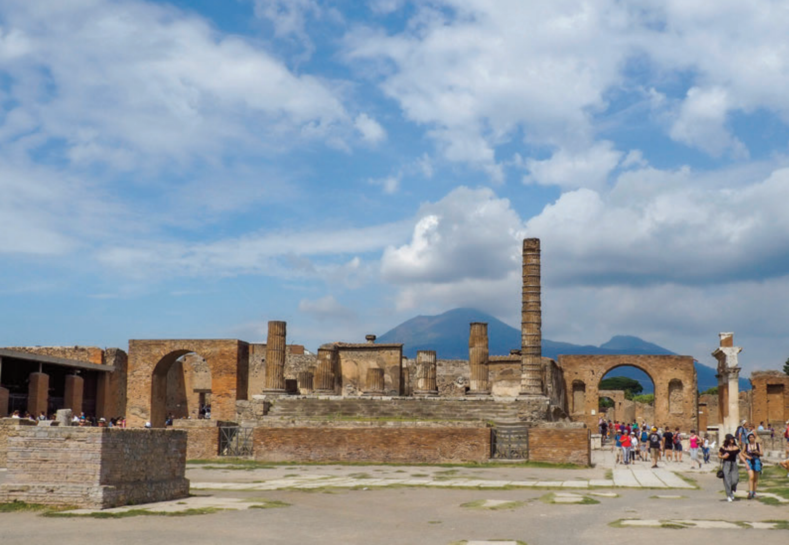
Capitolium, templo consagrado a la triada capitolina Júpiter, Juno y Minerva

tribunal, esto es, el estrado donde se sentaban los jueces, al que subían por medio de escaleras de madera. En este edificio se administraba justicia y se negociaban cuestiones económicas.