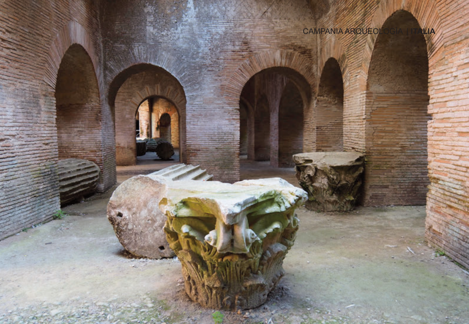
Capitel de orden compuesto junto a las columnas

subían a la arena las jaulas con las fieras, ya fuere para realizar espectáculos de ejecuciones o para disfrutar de las venationes, “peleas entre gladiadores y fieras” en los ludí financiados por el Editor o noble que así lo dispusiera para su mayor grandeza. Aquí estaban situados los mecanismos con las poleas para subir las jaulas con los animales al escenario.