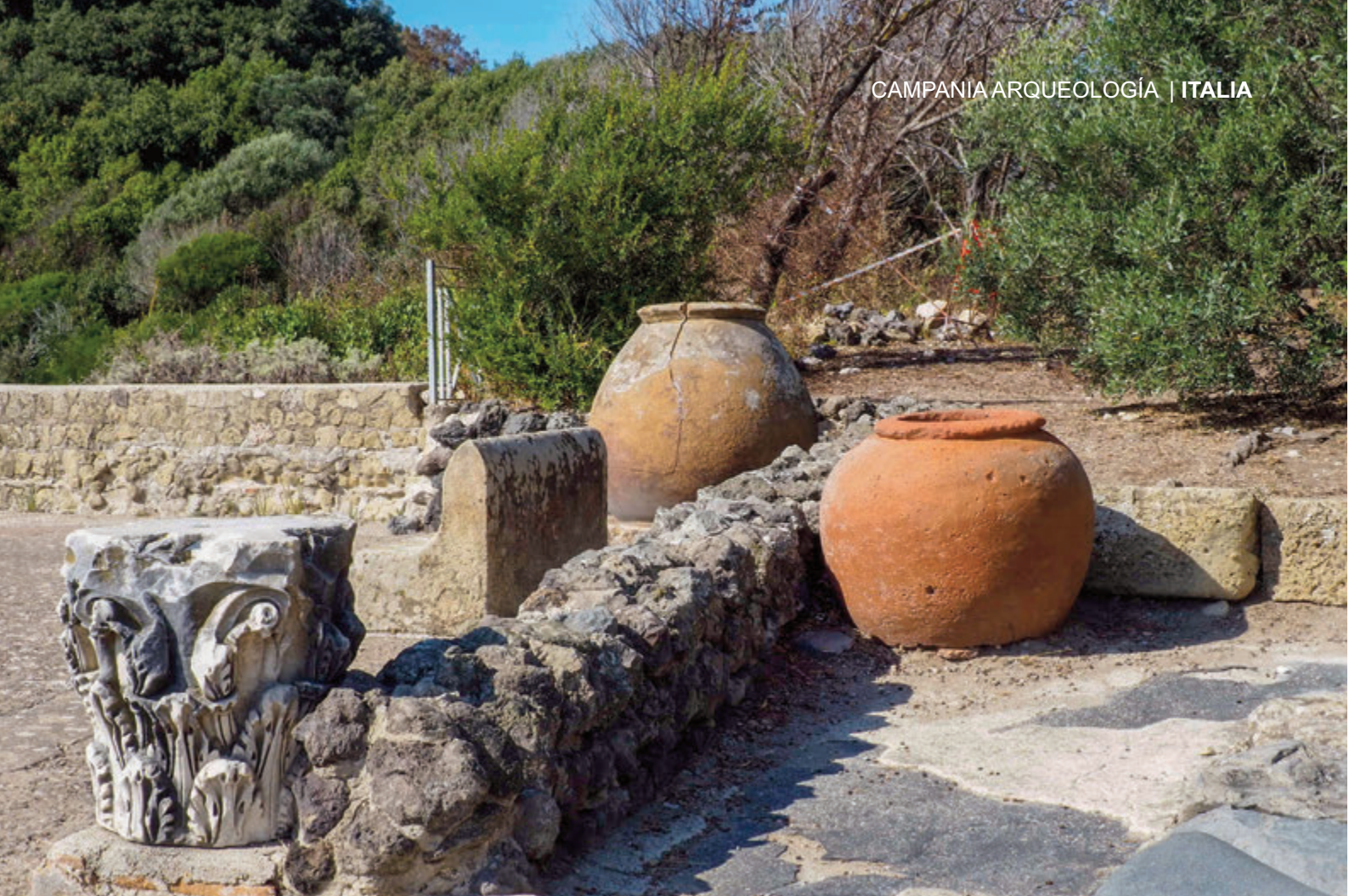
INFERIOR: ACCESO AL ANTRO DE LA SIBILA DE CUMAS