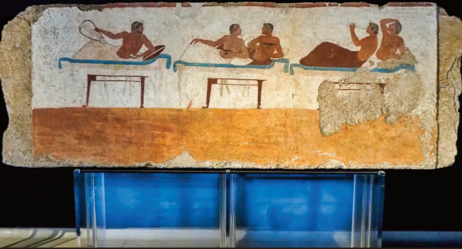
LOSA POLICROMADA CON ESCENAS DEL BANQUETE- TUMBA DEL SALTADOR DE TRAMPOLÍN