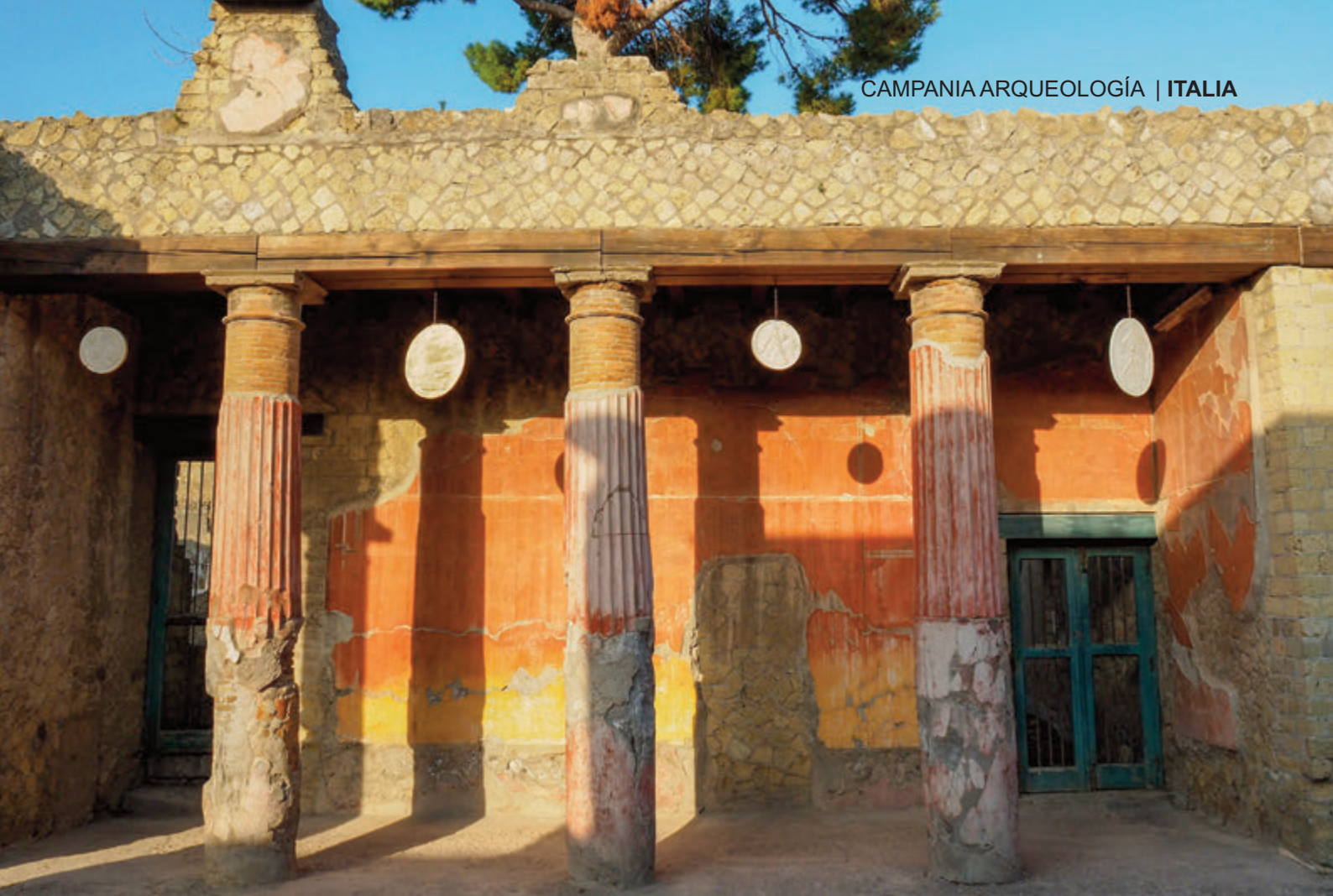
LA CASA DEL BAJORRELIEVE DE TÉLEFO, LA SEGUNDA MÁS GRANDE DE HERCULANO