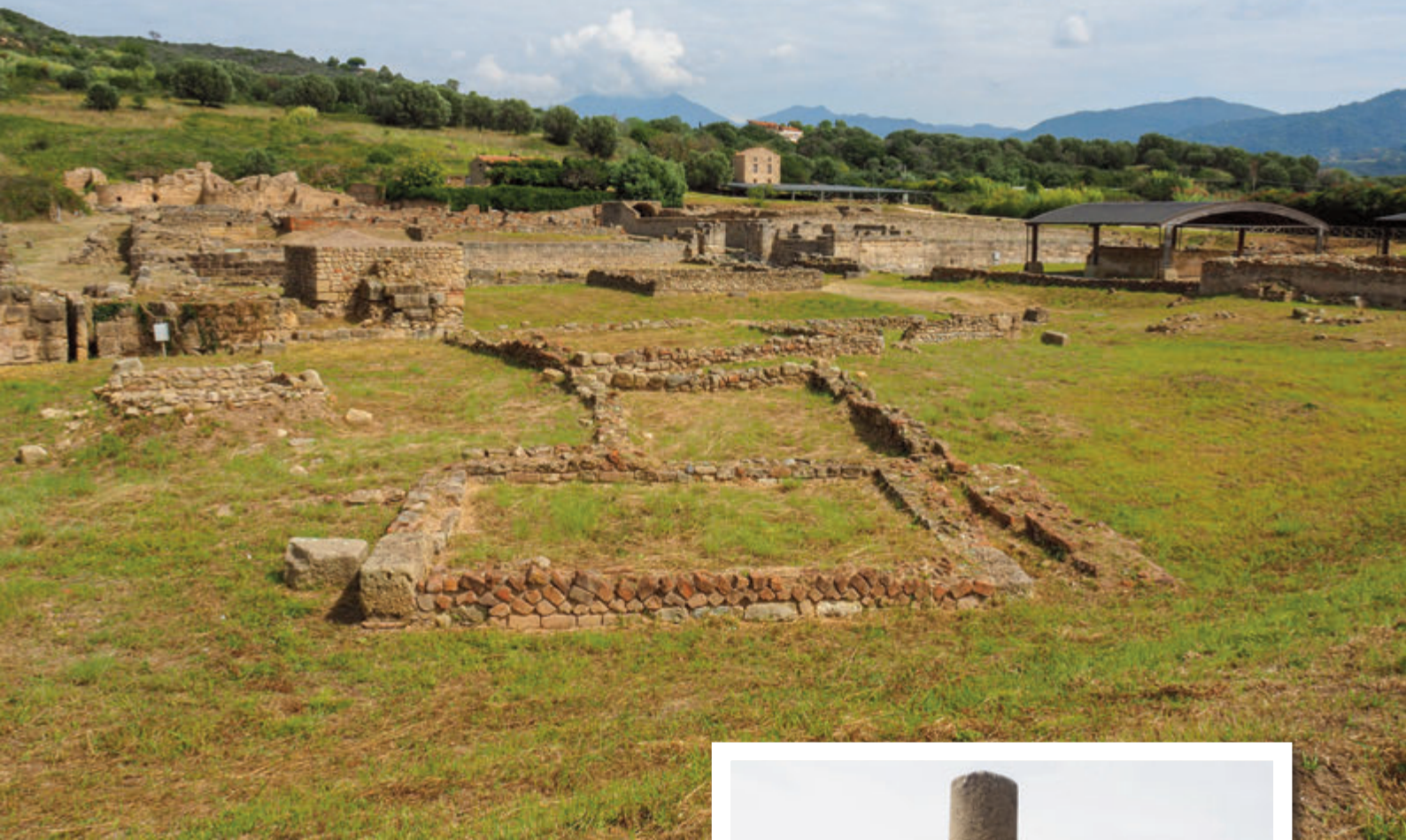
Yacimiento arqueológico de Velia