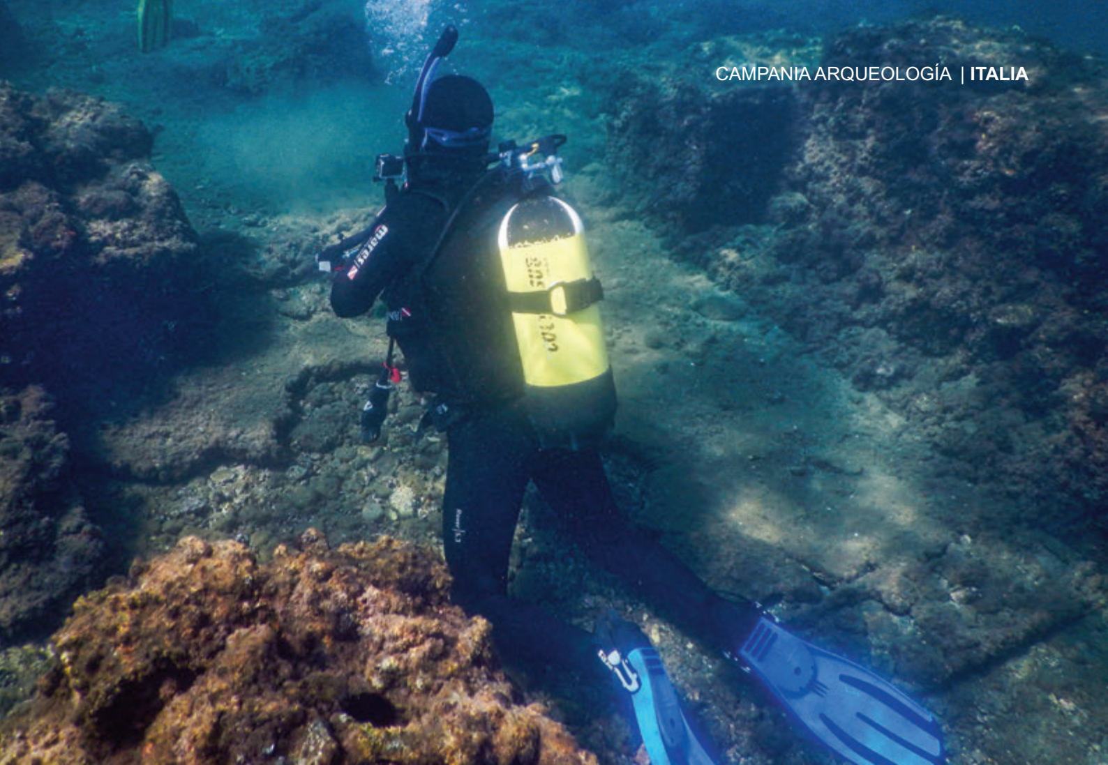
Centro Sub Campi Flegrei del Área Marina protegida de Baia

desde el siglo I a.C., la flota militar se trasladó a la cercana cuenca natural de Miseno y el puerto se destinó a fines civiles. Hoy en día es posible ver los restos de la estructura del puerto y algunos mosaicos a una profundidad de 3 a 5 metros.