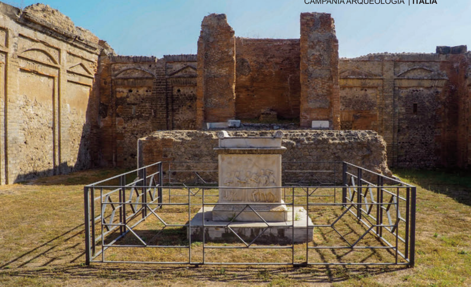
EL AEDES GENII AVGVSTI TEMPLETE, CONSAGRADO AL EMPERADOR VESPASIANO