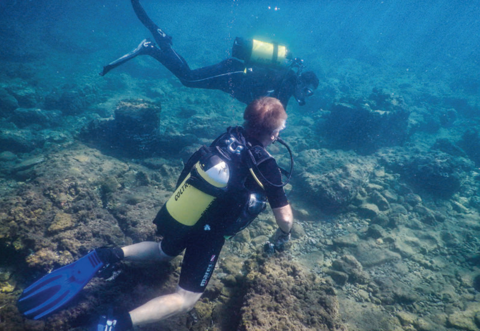
Arqueología submarina en Baia recorrido por Portus Julius

Así pues, viajamos a esta antigua ciudad, entrando de lleno a lo que fue La Magna Grecia , nombre que usaban los romanos para referirse al conjunto de colonias que fueron establecidas a lo largo de las costas del sur de la Península Itálica, además de la isla de Sicilia y que hablaban un idioma diferente al suyo.