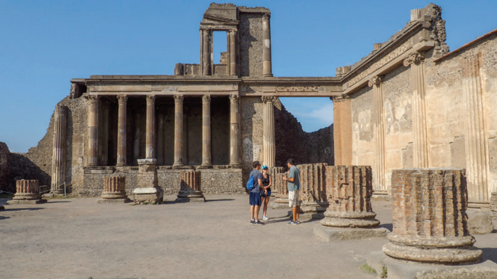
BASÍLICA DONDE SE UBICABA EL TRIBUNAL Y ADMINISTRABA JUSTICIA