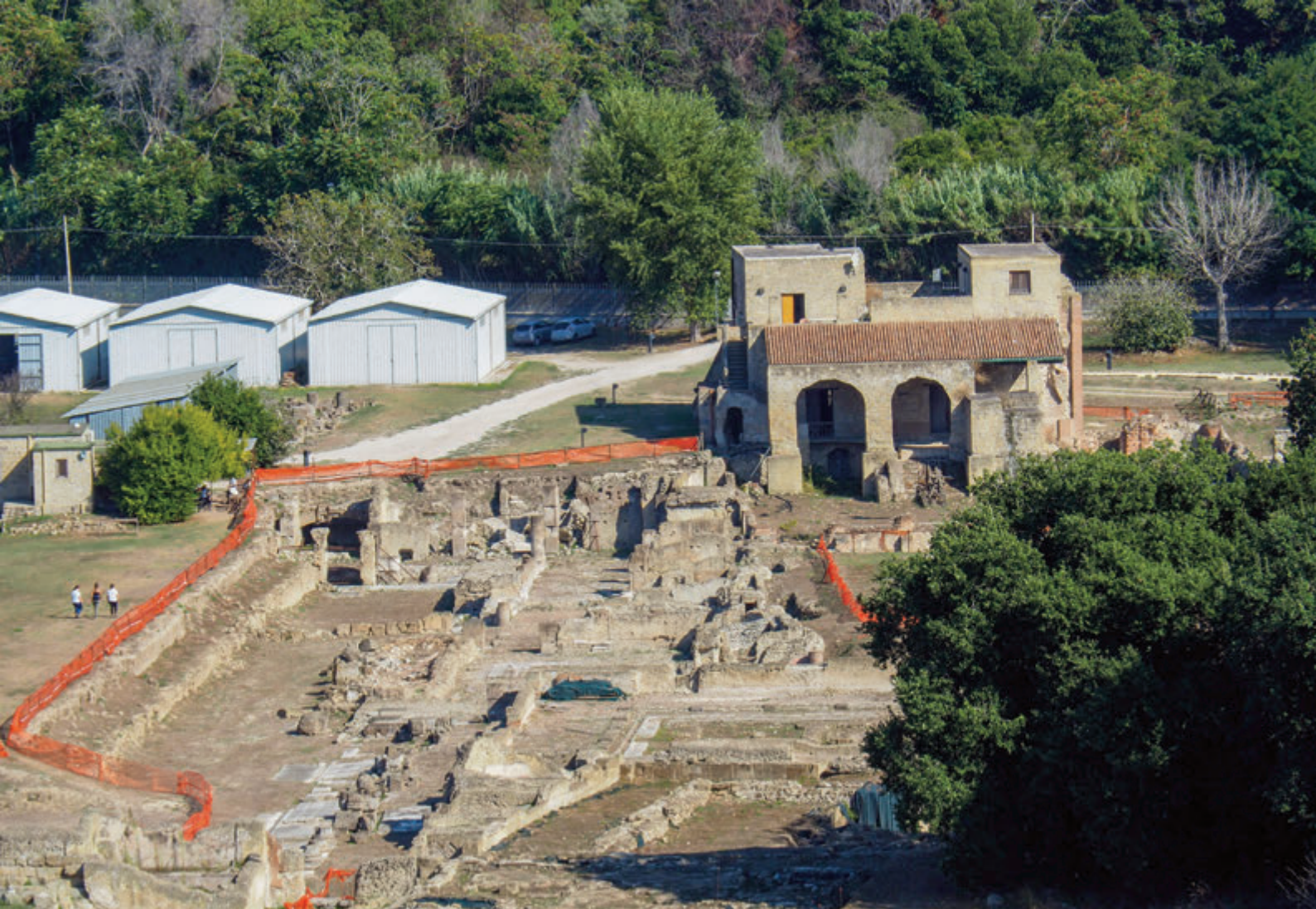
Yacimiento arqueológico de Cumas