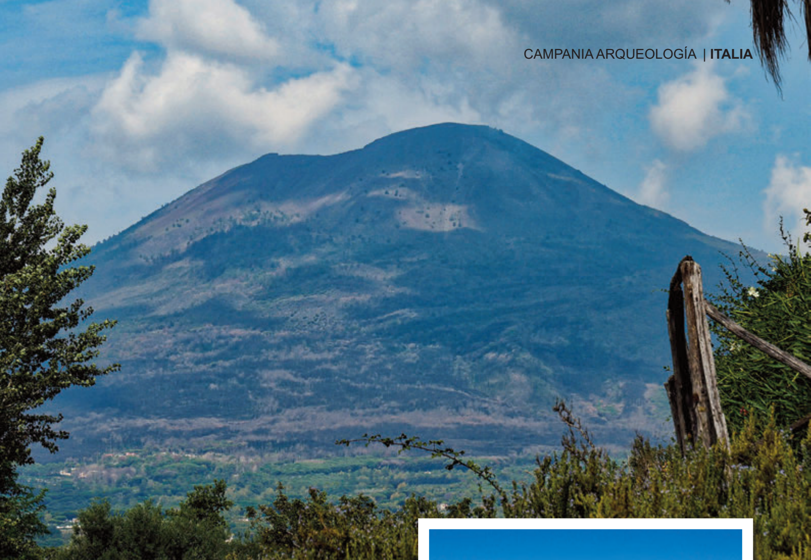
Panorámica del volcán Vesubio

importante y que merecía ser contemplado desde más cerca. Ordena que se le prepare un navío veloz, y me ofrece la oportunidad de ir con él, si yo lo deseaba; le respondió que prefería continuar estudiando, y precisamente él me había dado algún material para que yo lo escribiese. Cuando salía de casa, recibe un mensaje de Rectina, esposa de su amigo Tascio, aterrorizada por el peligro que la amenazaba (pues su villa estaba al pie de la montaña y no tenía ninguna escapatoria, excepto por mar); le rogaba que la salvase de esa situación tan desesperada”.