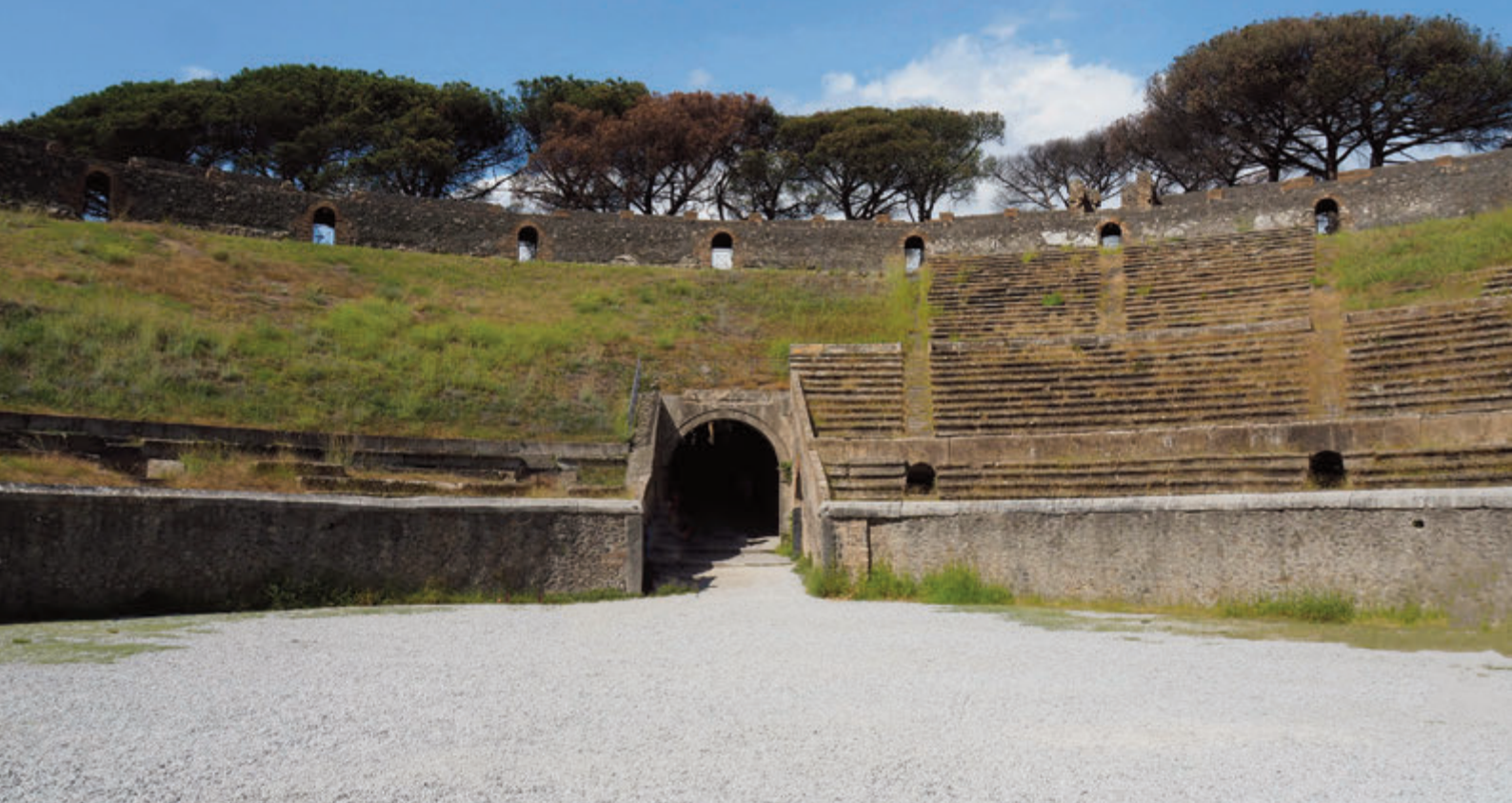
VISTA DE LA ARENA DEL CIRCO – PALESTRA DEL GIMNASIO GRANDE