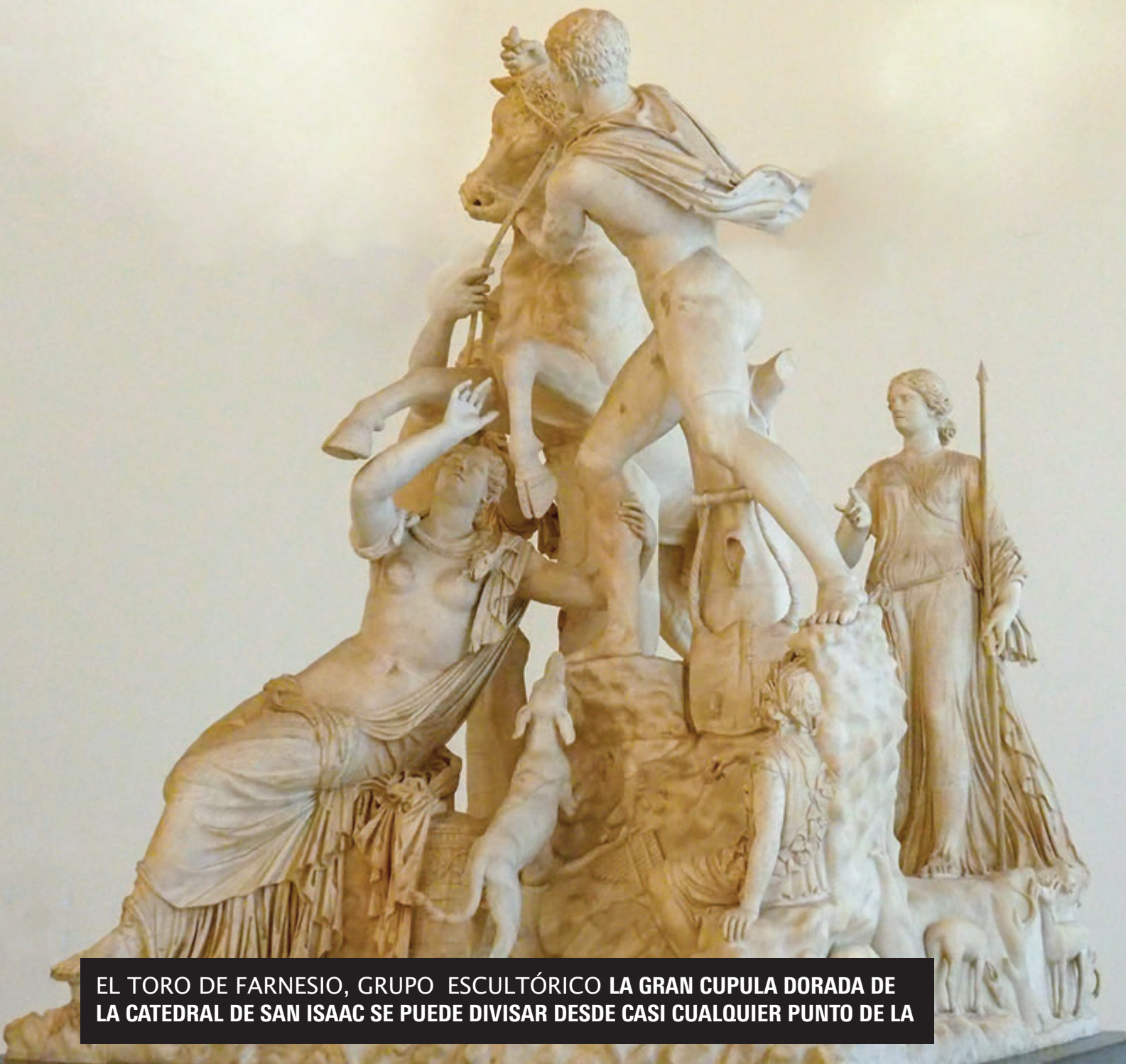
EL TORO DE FARNESIO, GRUPO ESCULTÓRICO LA GRAN CUPULA DORADA DE LA CATEDRAL DE SAN ISAAC SE PUEDE DIVISAR DESDE CASI CUALQUIER PUNTO DE LA