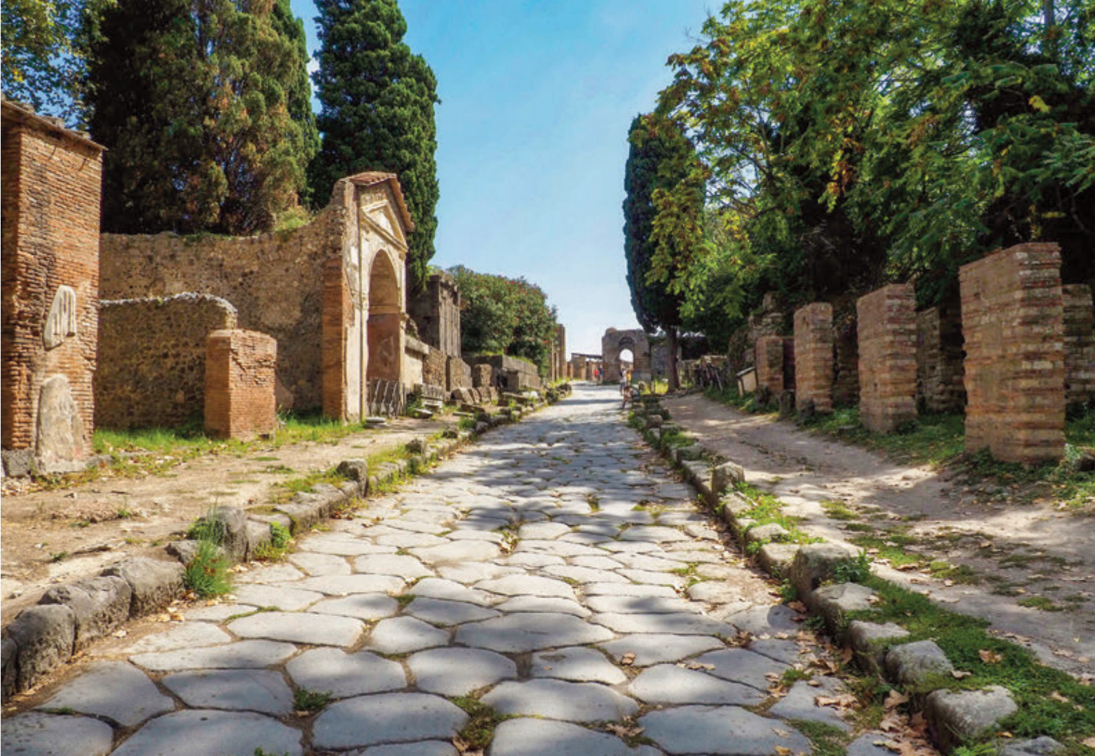
Vía de las tumbas en la puerta de Herculano en Pompeya