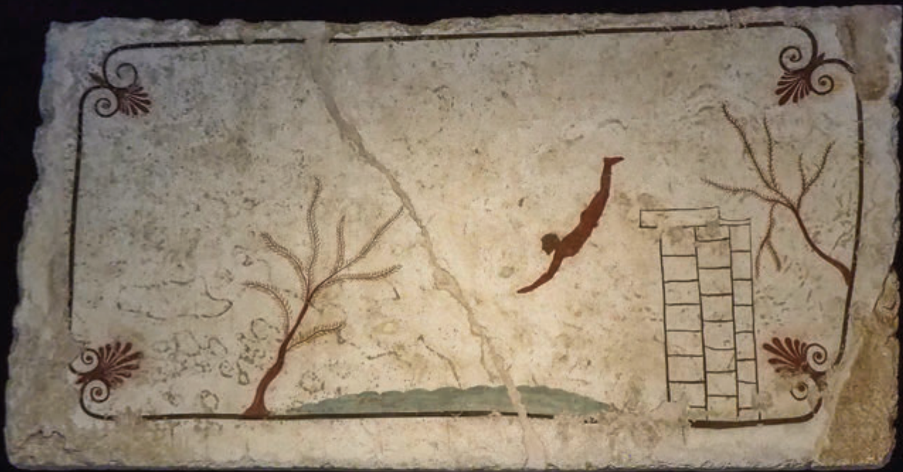
Losa de la tumba del Tufatore y jarrón helenístico