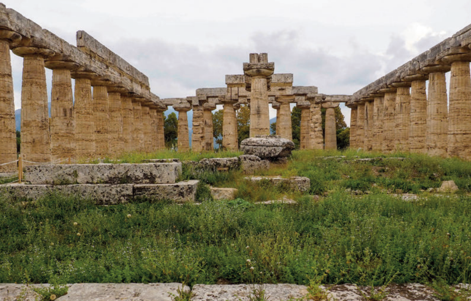
Interior de la Basílica en Paestum - Base de la edad romana con inscripción conmemorativa

remonta al siglo V a.C. y es considerado como un magnífico ejemplo de la arquitectura dórica en la península itálica. La atribución a Neptuno se debe a los investigadores del siglo XVIII que creyeron se había construido en honor del dios Poseidón-Neptuno que da nombre a la ciudad. Sin embargo, estudios recientes lo atribuyen a Apolo, en su calidad de médico.