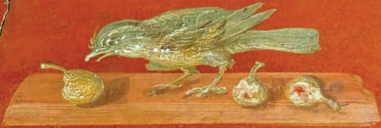
OPLONTIS- FRESCOS DEL SALÓN EN ESTILO POMPEYANO