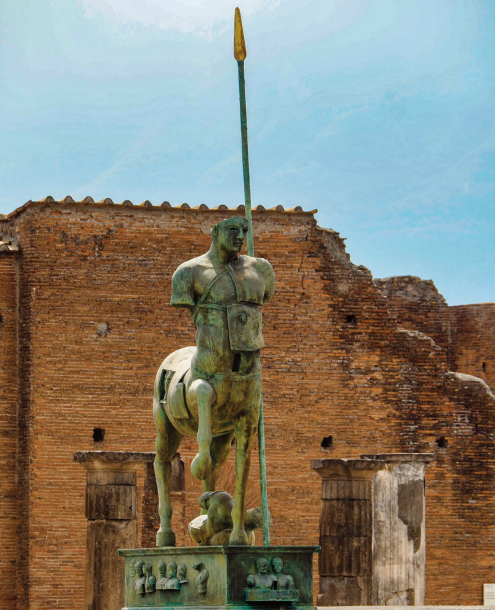
ESCUPTURA EN BRONCE REPRESENTANDO UN CENTAURO EN LA PLAZA DEL FORO DE POMPEYA LA GRAN CUPULA DORADA DE LA CATEDRAL DE SAN ISAAC