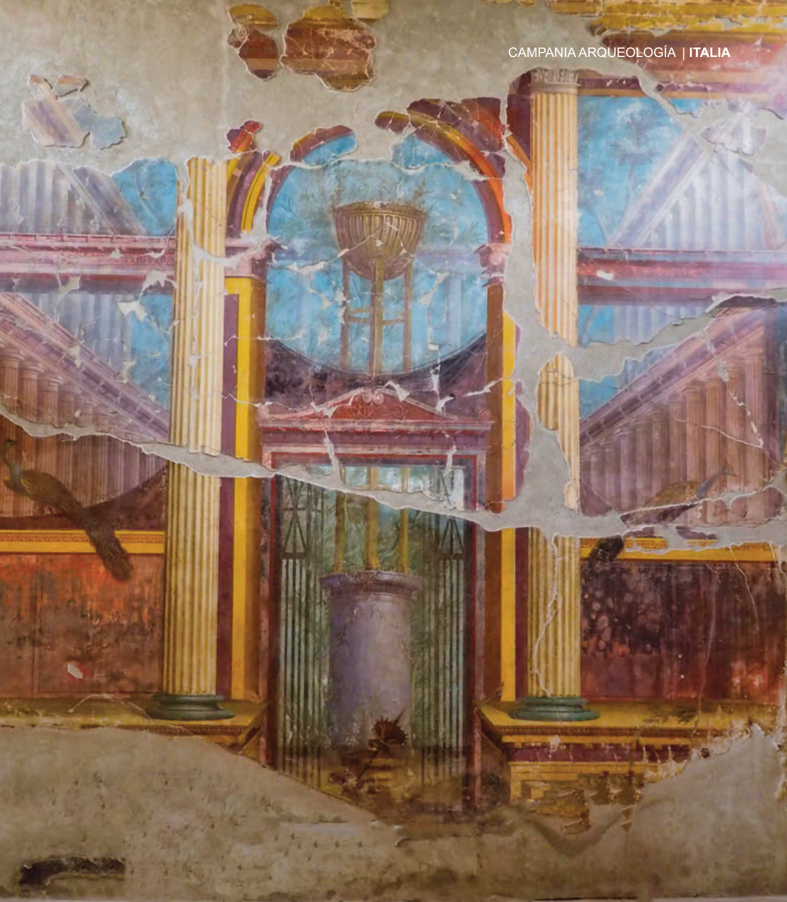
OPLONTIS: FRAGMENTO DERECHO DEL GRAN FRESCO DEL SALÓN CON LA REPRESENTACIÓN DE UN SANTUARIO AL DIOS APOLONA Y LA GRAN CUPULA