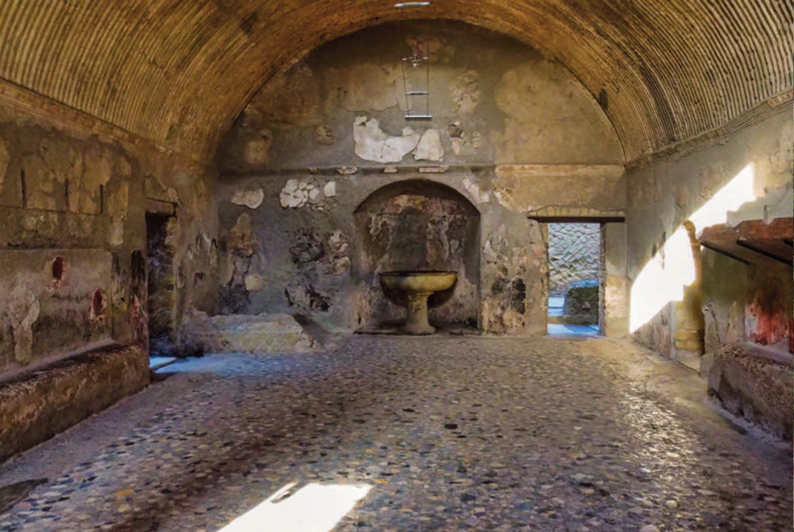
HERCULANO: SUPERIOR, INTERIOR ABOVEDADO DE LAS TERMAS Y LA CASA DE LOS CIERVOS