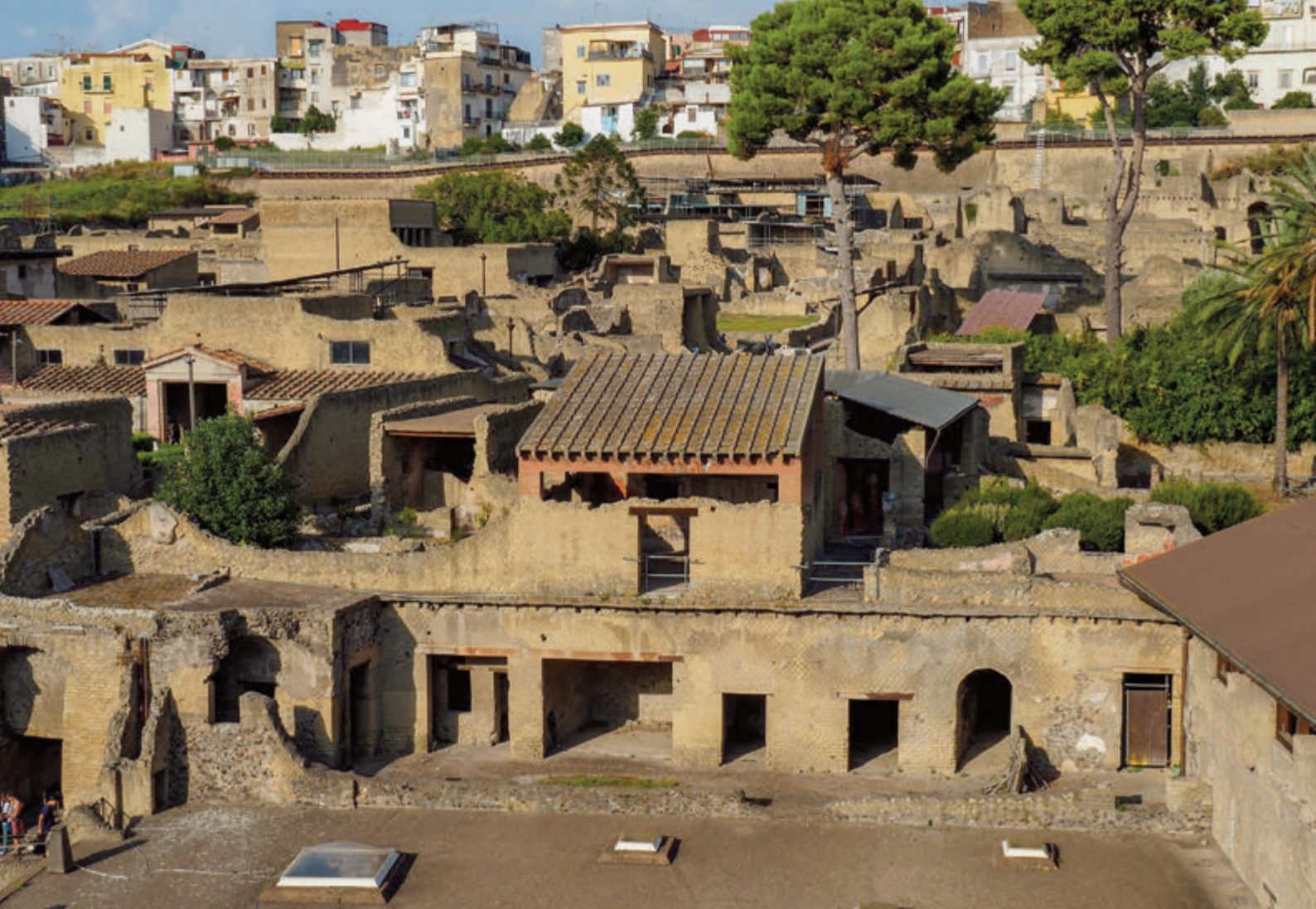
Área sagrada en la terraza sur