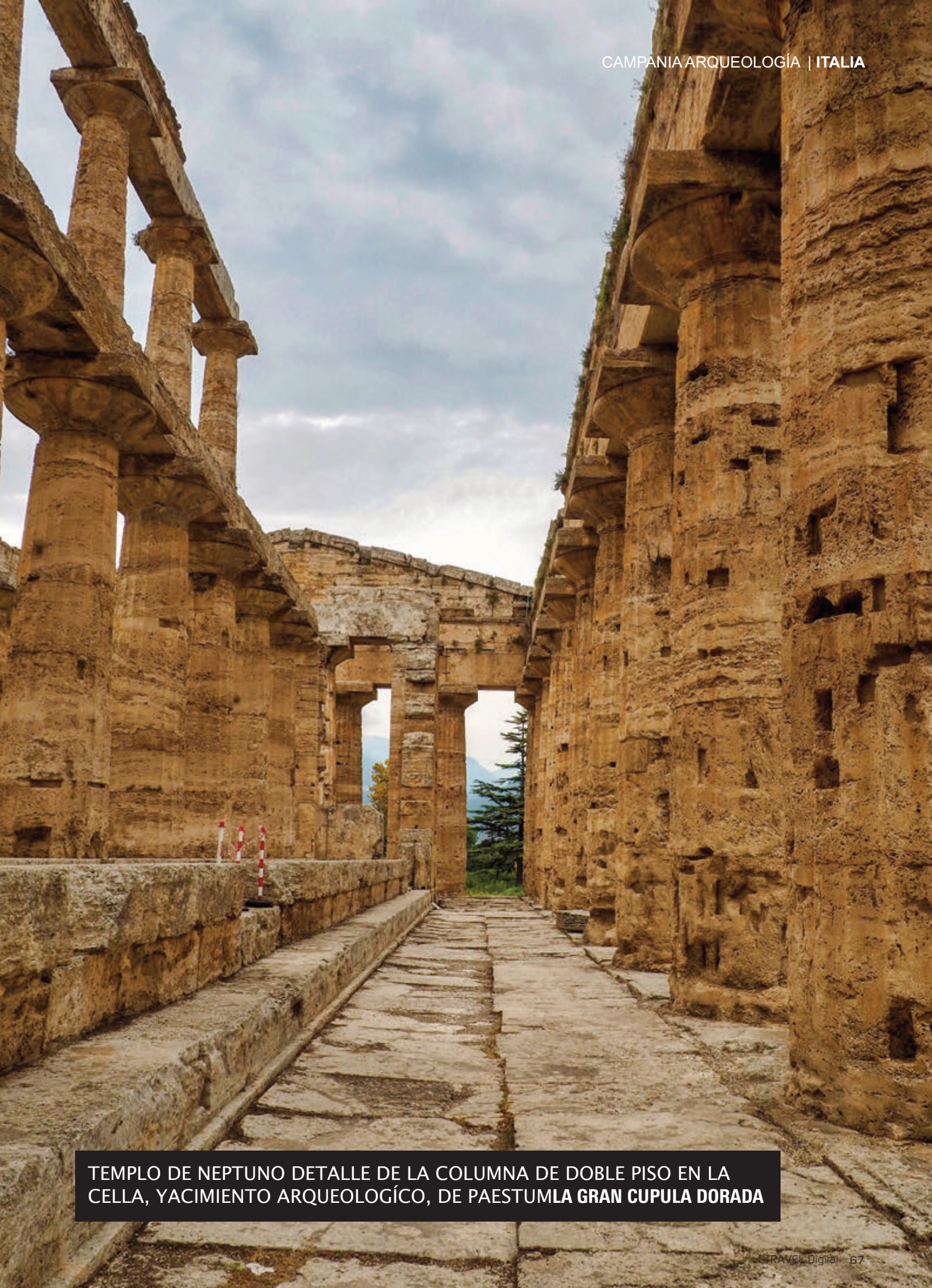
TEMPLO DE NEPTUNO DETALLE DE LA COLUMNA DE DOBLE PISO EN LA CELLA, YACIMIENTO ARQUEOLÓGICO, DE PAESTUM LA GRAN CUPULA DORADA