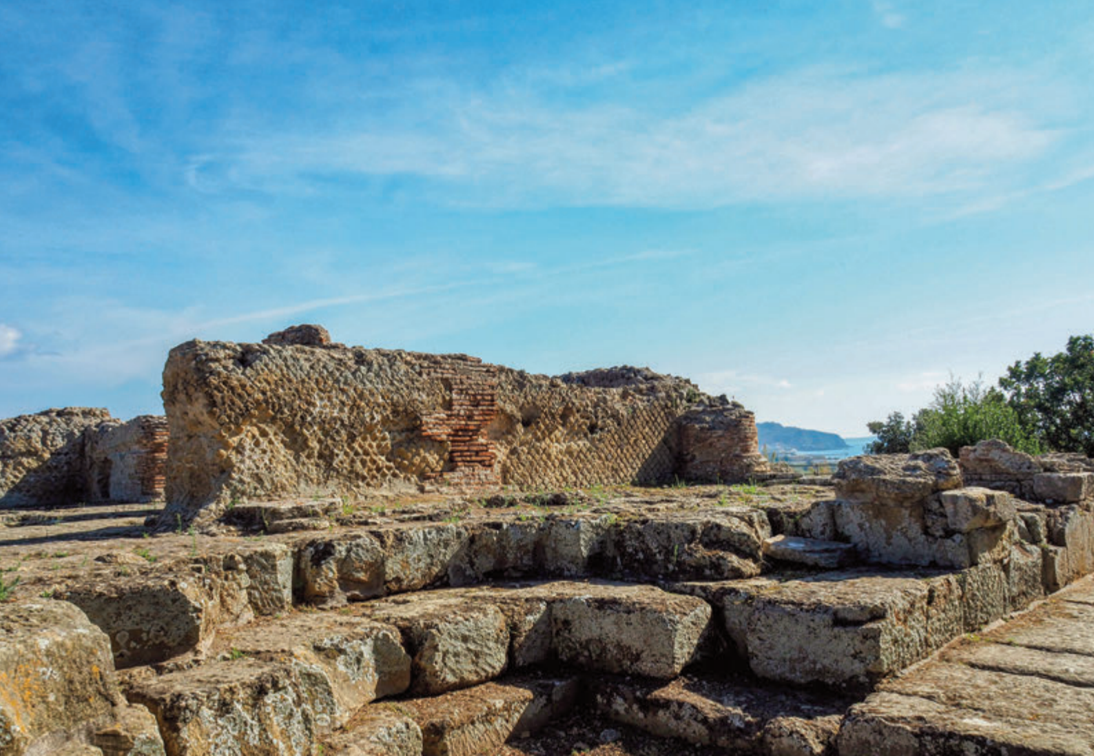
Restos del Santuario de Apolo en Cumas

La esplendorosa ciudad estaba bien fortificada y pronto se convirtió en un lugar de intenso comercio de donde partían importantes rutas marítimas y terrestres. Cumas no hubiera tenido mayor relevancia que la comentada si no hubiera sido porque en ella habitaba la famosa Sibila de Cumas , adivina y oráculo sagrado. Cuenta la leyenda que el dios Apolo amaba a la Sibila de Cumas , una joven de belleza sin par llamada Amaltea , a la cual había prometido satisfacer el primer deseo que expresara. Ella pidió una larga vida... pero olvidó pedirle la juventud, que el dios le prometió a cambio de su virginidad, a lo que se negó. Conforme envejecía se volvía cada vez más menuda y seca, y, cansada de vivir, sólo anhelaba la muerte.