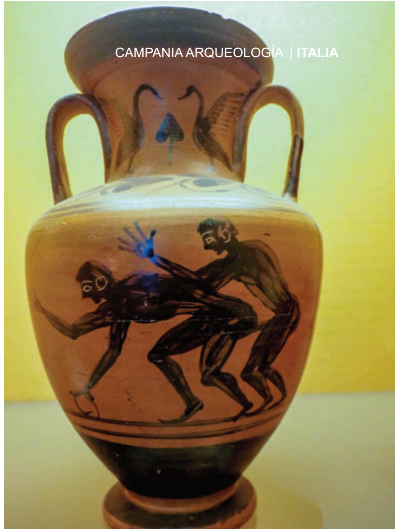
BRAZALETE FORMA DE SERPIENTE-JARRÓN CON PINTURA ERÓTICA- MOSAICO CASA DEL FAUNO