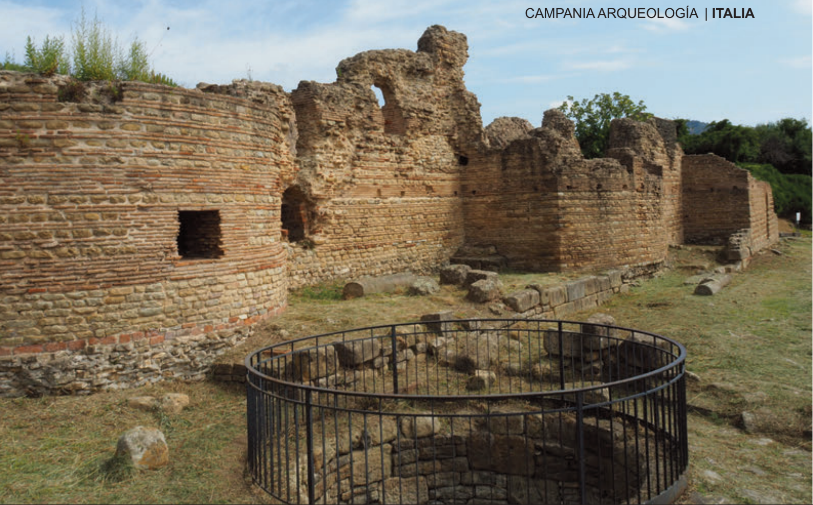
MUROS EXTERIORES DE LAS TERMAS Y MOSAICO INTERIOR EN VELIA