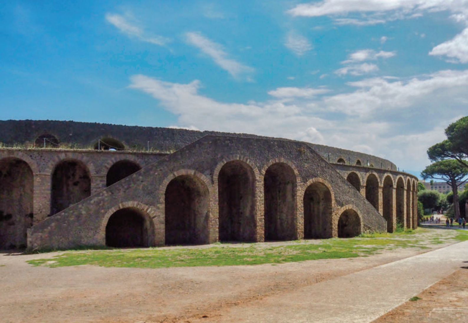
Vista del exterior del circo de Pompeya - inferior: fresco representado la reyerta entre Pompeyanos y Nolanos

cavea y la summa cavea, para los demás. A menudo, se extendía un amplio velum o toldo, sobre las gradas, para proteger a los espectadores del sol. El edificio estaba destinado a los combates de gladiadores. En el eje mayor de la arena se abrían dos puertas: por una pasaba el desfile de los que tomarían parte en los juegos; mientras que por la otra sacaban los cuerpos exánimes o a los heridos. En el año 59 d.C., un grupo de «forofos» pompeyanos y otro de Nocera protagonizaron una violenta refriega y la «arena fue cerrada durante 10 años» (la medida se anularía tras el terremoto de 62 d.C. Probablemente este hecho se produjo por el resentimiento de los hinchas nocerarnos hacia Pompeya, ya que poco antes se había transformado en colonia y había asimilado parte de su territorio...). Este episodio está documentado en un fresco que se conserva en el Museo de Arqueología de Nápoles.