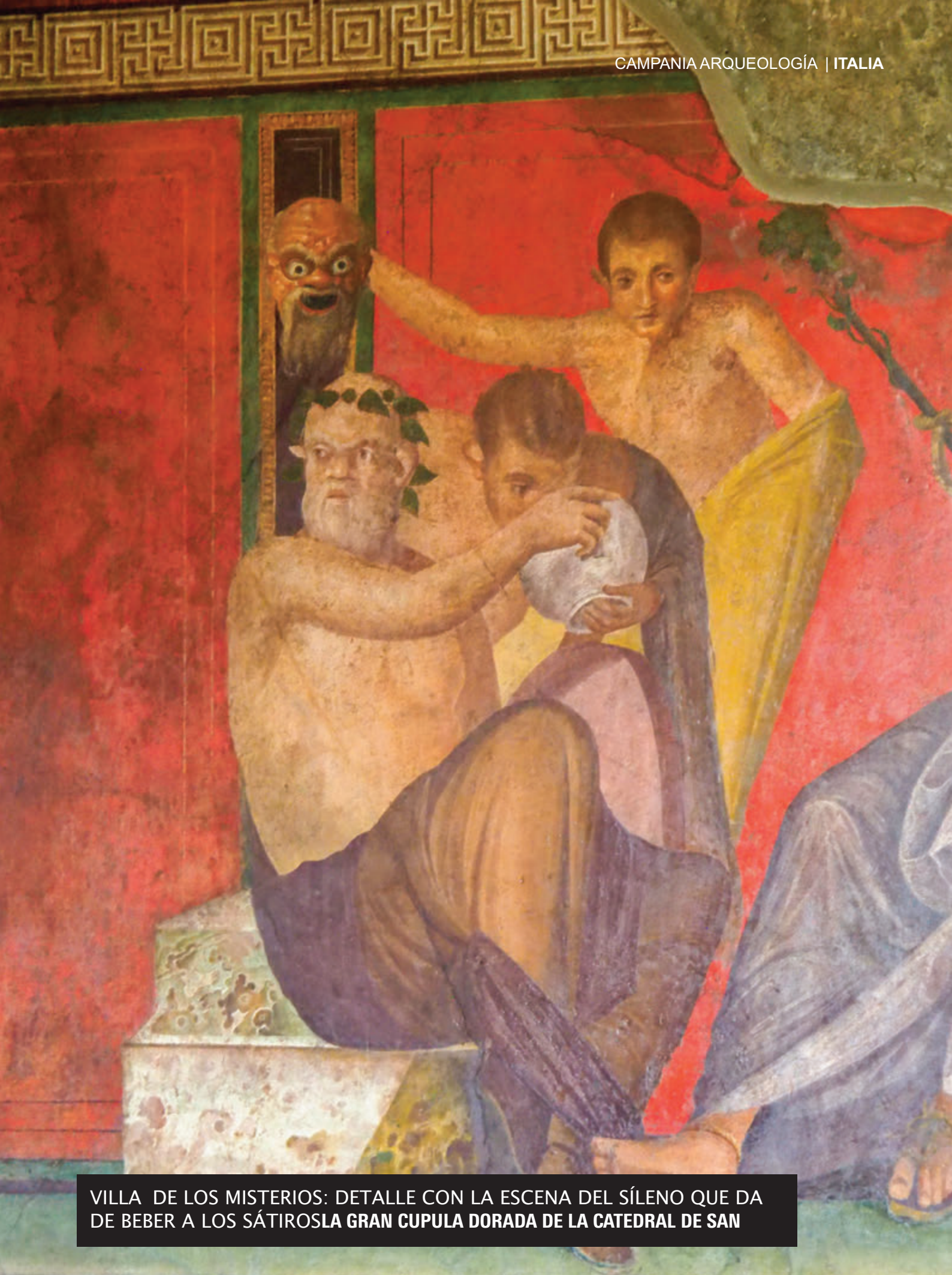
VILLA DE LOS MISTERIOS: DETALLE CON LA ESCENA DEL SÍLENO QUE DA DE BEBER A LOS SÁTIROSLA GRAN CUPULA DORADA DE LA CATEDRAL DE SAN