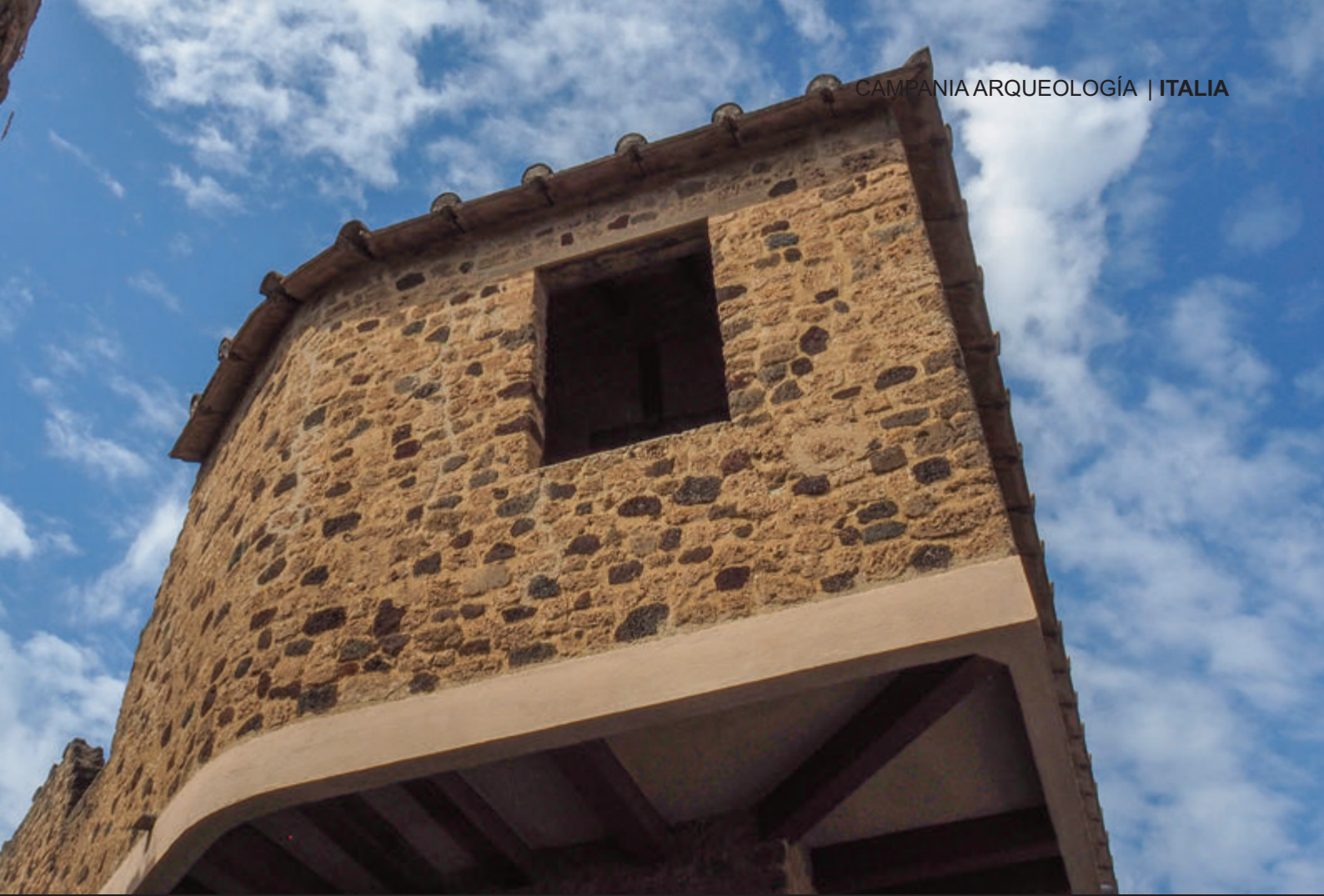
SUPERIOR: LUPANAR DE POMPEYA – INFERIOR: BATANES DE STEPHANUS