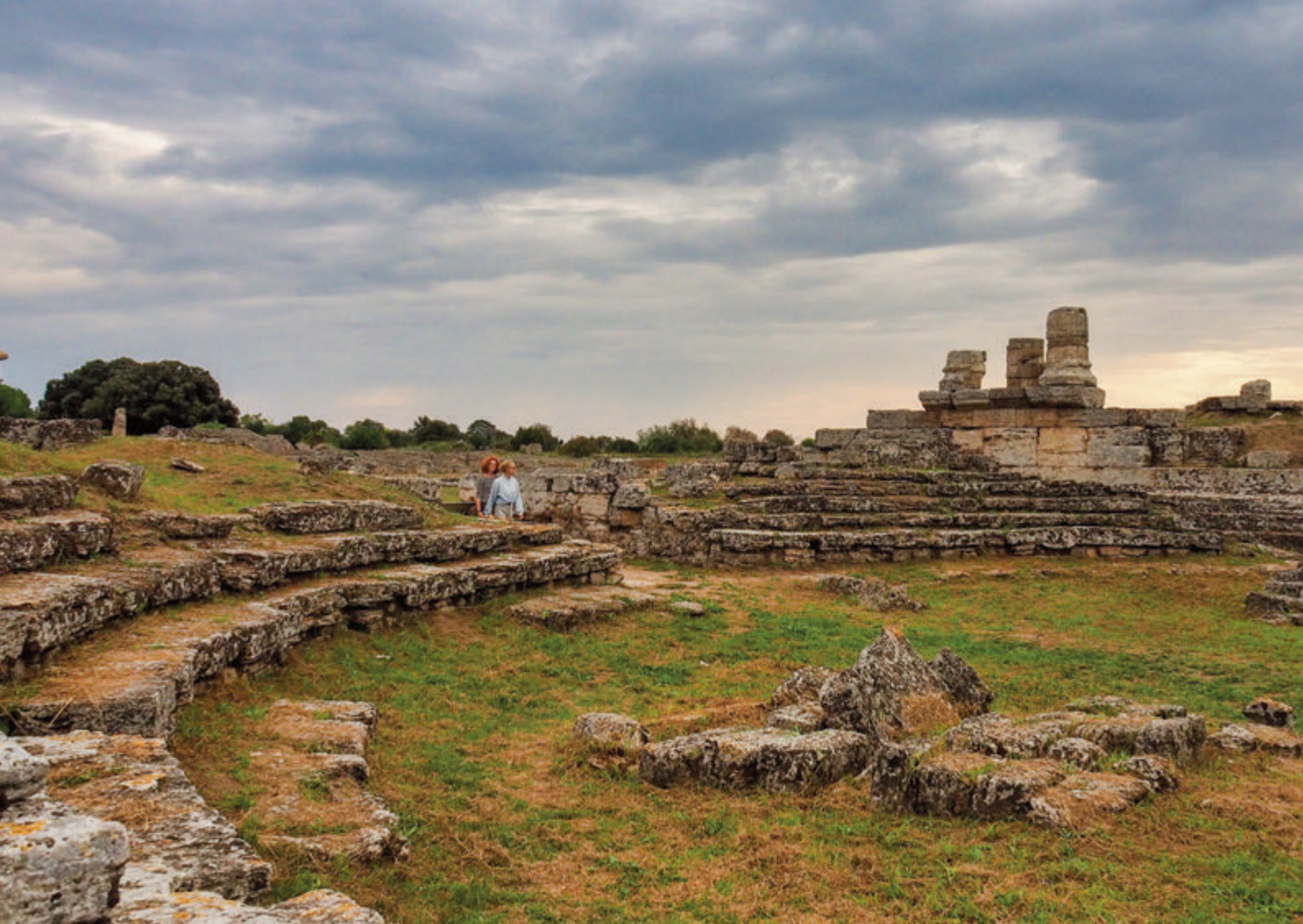
El Comitium donde se celebraban las reuniones de la curia

de los monumentos que detallan la historia del ágora, el llamado santuario subterráneo. Un heroon, se podría decir cenotafio, una tumba vacía destinada al culto de una persona importante que fue ensalzado a héroe después de su muerte. Más hacia delante siempre en dirección sur, encontramos otros edificios públicos como el Ekklesiasasterion , edificio donde se reunía la asamblea de todos los ciudadanos adultos, varones, que tenían derecho a participar en la vida política, el cual se encuentra en un excelente estado de conservación pues fue sepultado dado a la política romana de hacer desaparecer todo vestigio de otras culturas que no fueran de su conveniencia, y el anfiteatro cortado en dos partes por la carretera construida en 1829. Actualmente solo se ve la mitad occidental, se construyó en el siglo I d.C. ampliándose posteriormente entre fines del siglo I y principios del siglo II.