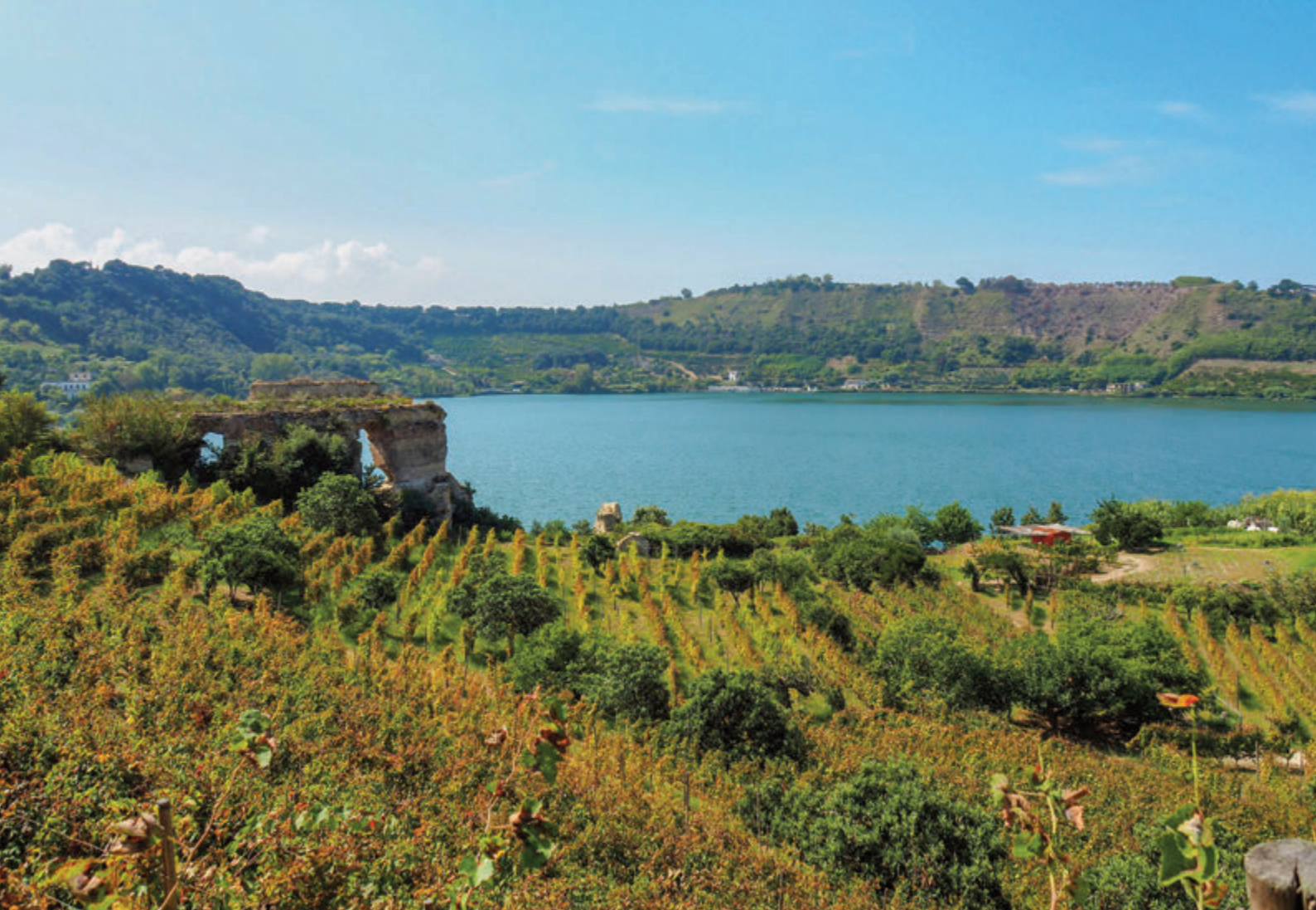
Lago del Averno y viñedos históricos