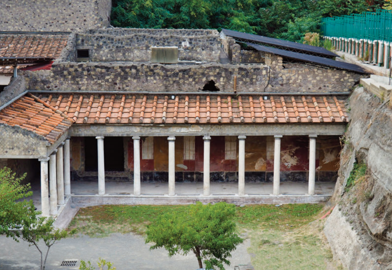
Acceso a la Villa de Oplontis en Torre Anunciata