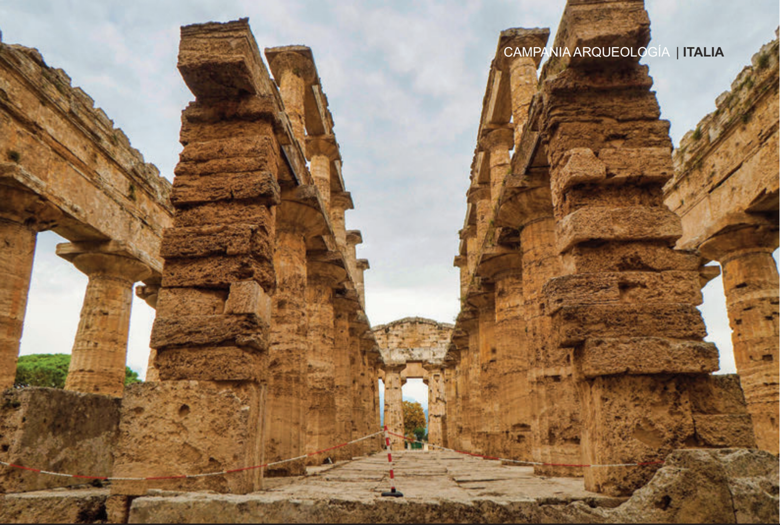
SANTUARIO SUBTERRÁNEO DE HERON - PANORÁMICA DE TEMPLO DE NEPTUNO