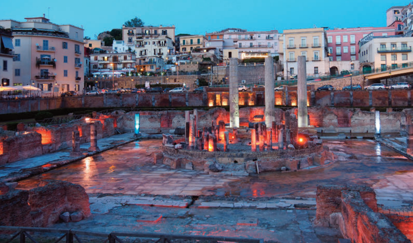
Templo de Serapis en Pozzuoli