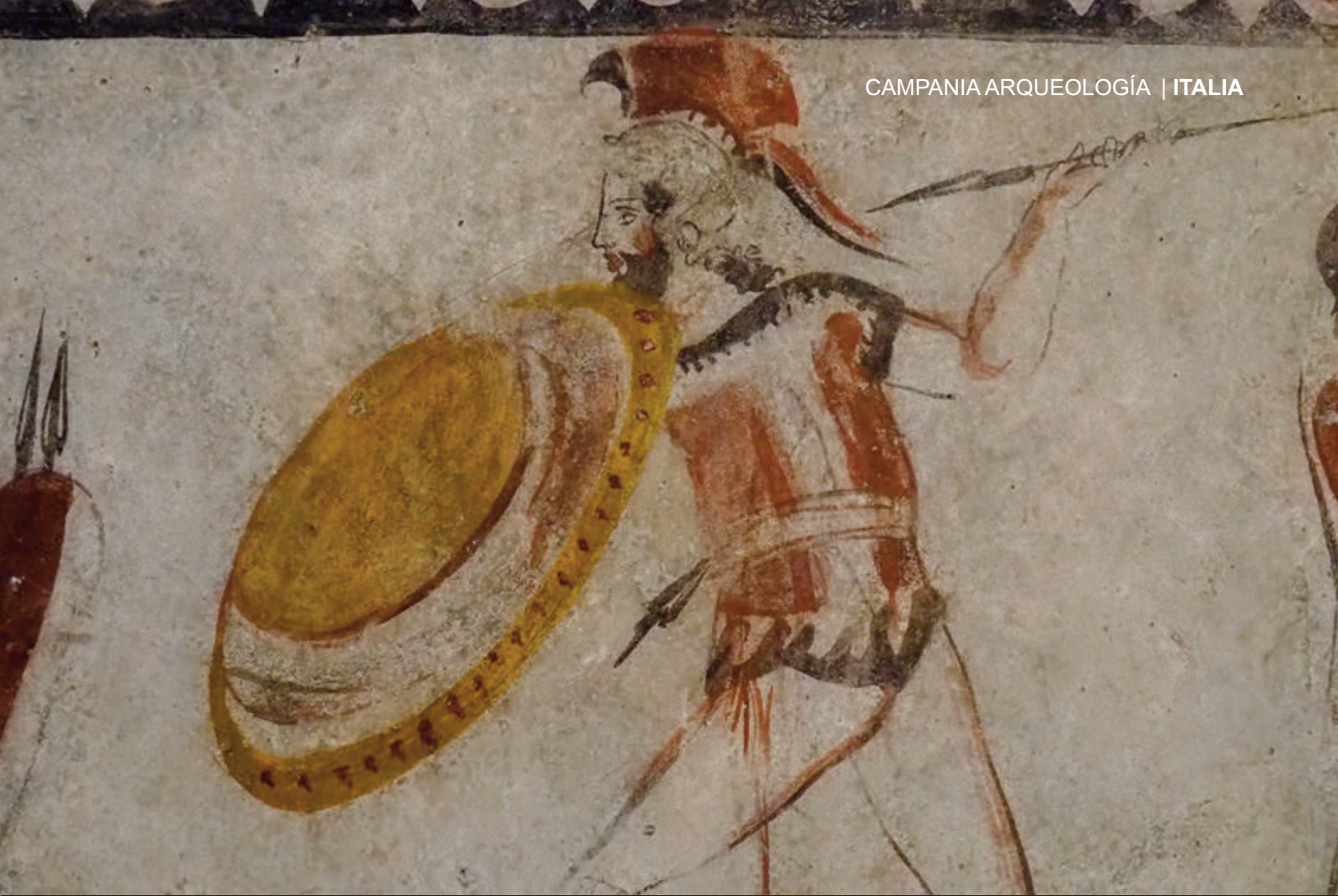
ESCENA DE LA TUMBA DEL CABALLERO NEGRO, NECRÓPOLIS DE ADRINOLO