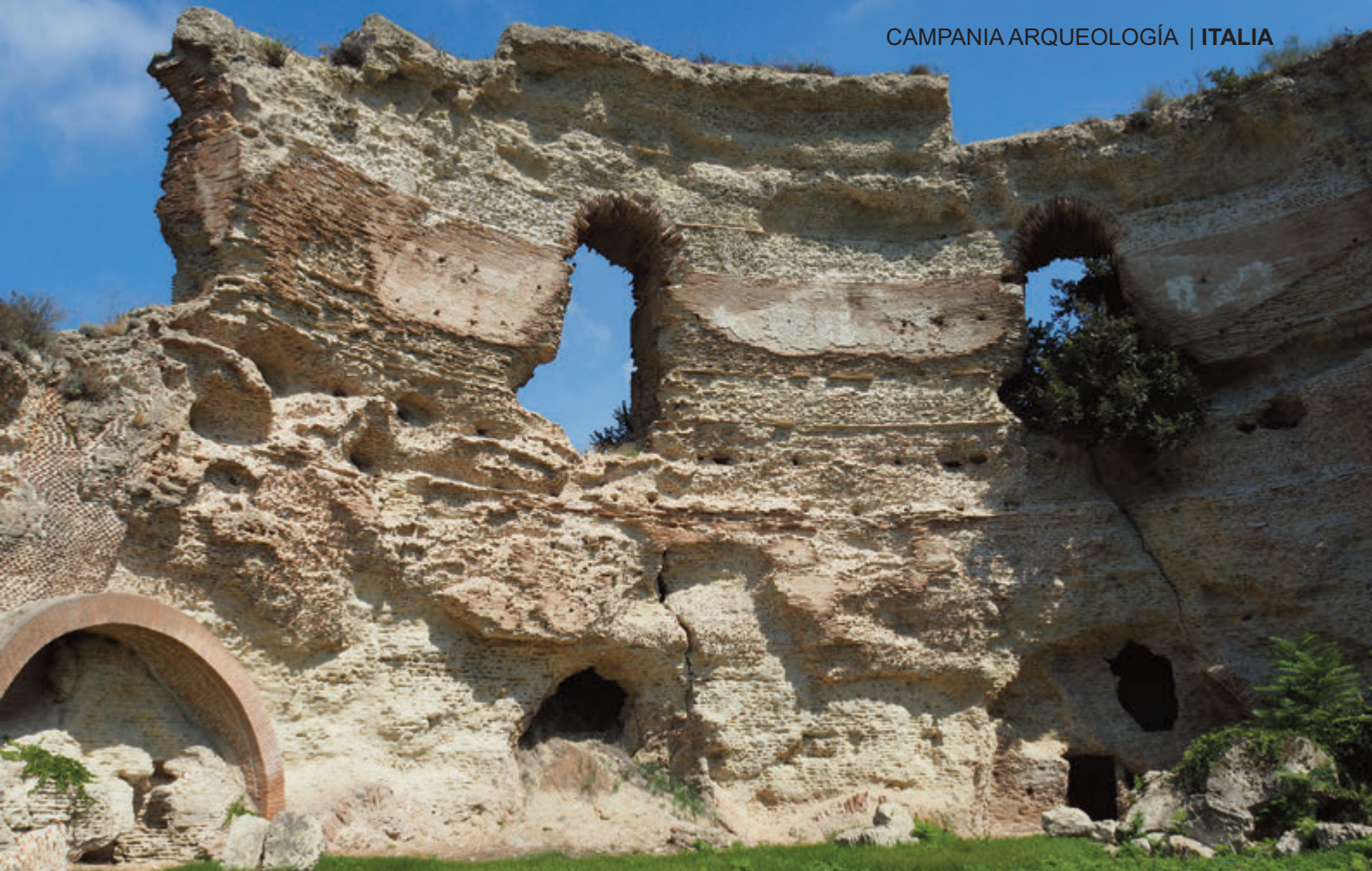
SUPERIOR: TERMAS Y TEMPLO DE APOLO – VIÑEDOS CIRCULARES EN LAS LADERAS DEL AVERNO