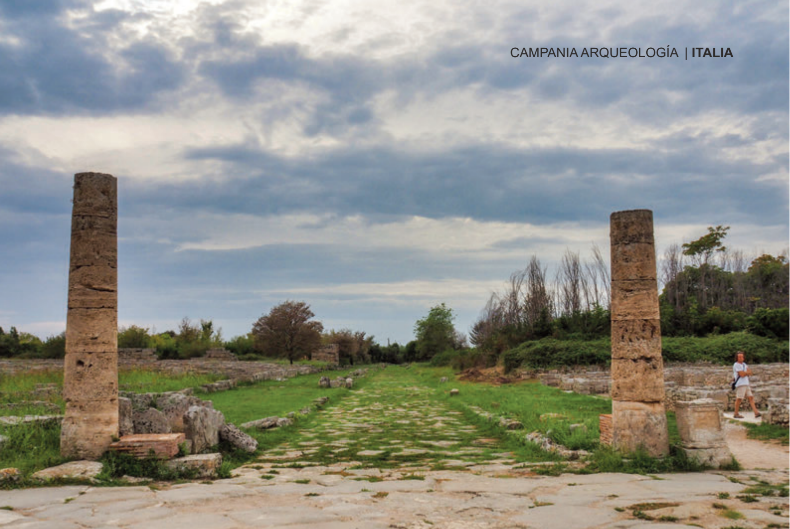
CALLE DE LOS BARRIOS RESIDENCIALES – SOPORTES DE LA CASA CON PISCINA