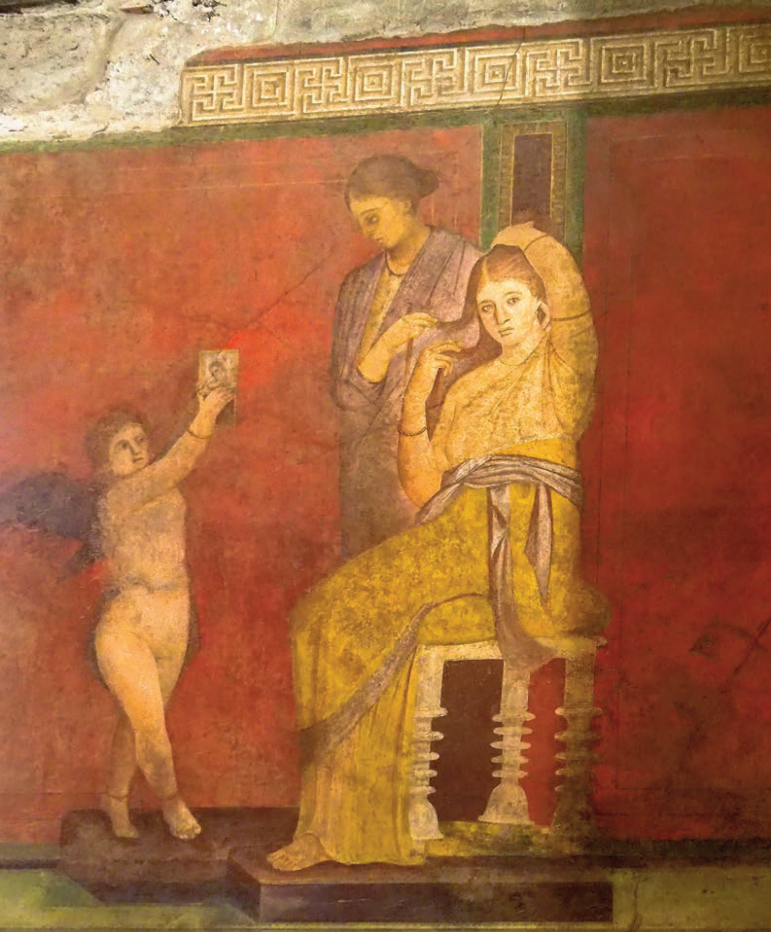
VILLA DE LOS MISTERIOS: FRESCO DE LA HABITACIÓN DE TRICLINIO CON ESCENA DEL PEINADO NUPCIALLA GRAN CUPULA DORADA DE LA CATEDRAL DE