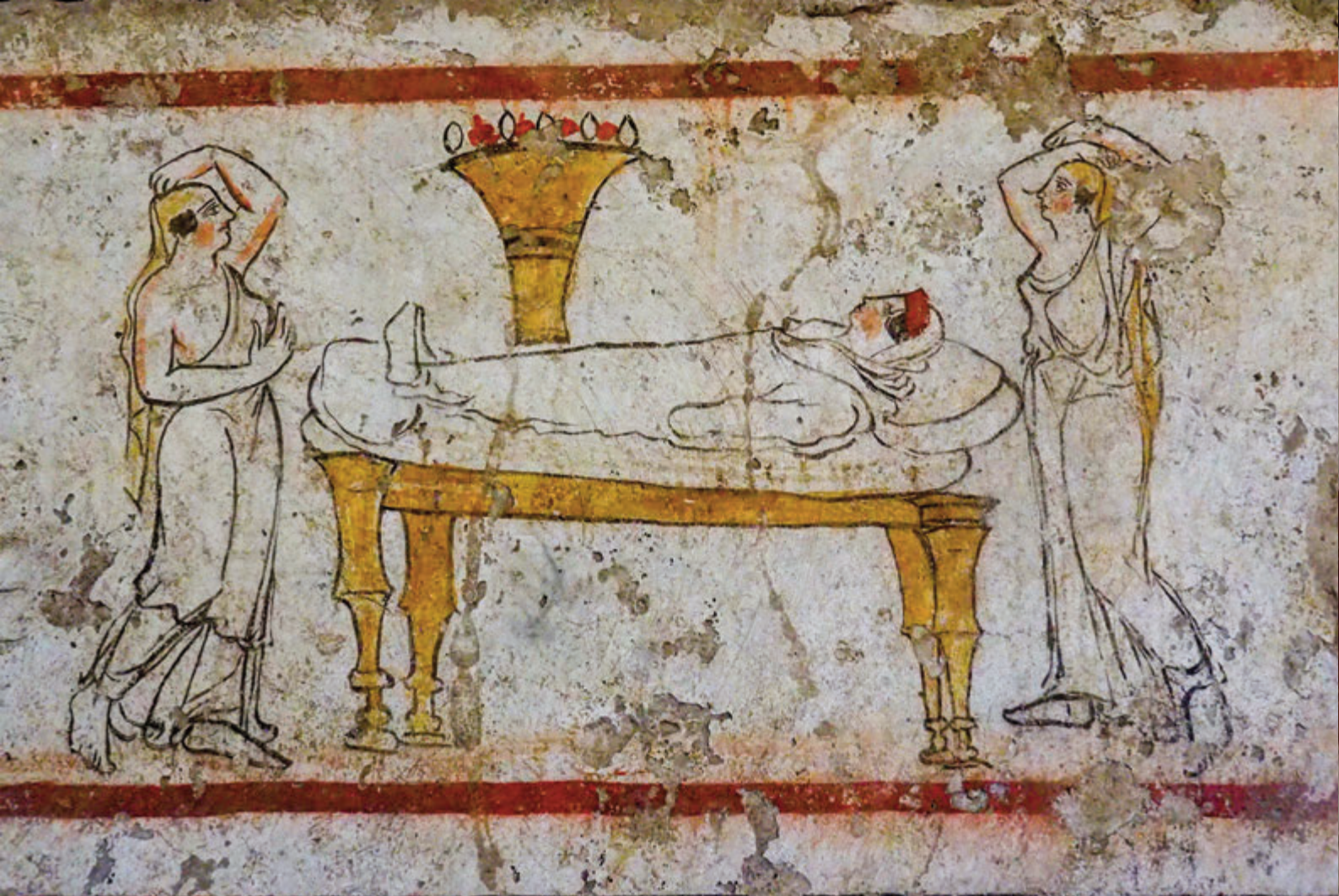
LOSA PINTADA ESCENA DE LA DIFUNTA EN LECHO FÚNEBRE MUSEO DE PAESTUM