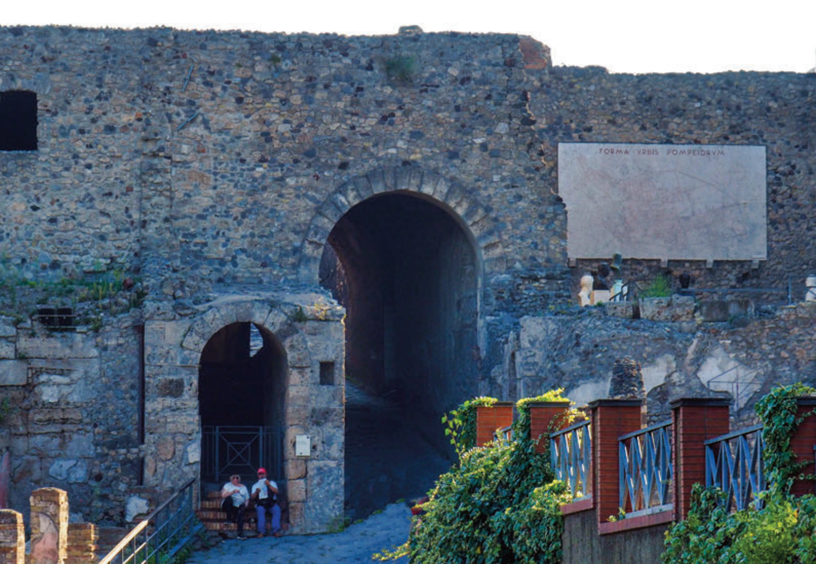
Porta Marina y parte de la muralla, acceso principal a la ciudad de Pompeya