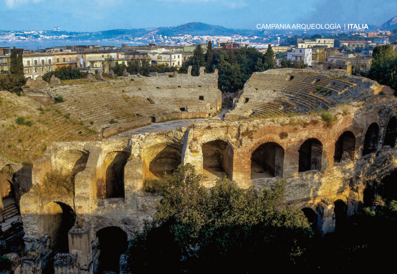
Anfiteatro Flavio, vista aérea

de Pozzuoli. El agua actualmente sigue presente en el templo de Serapis, pero se debe a un manantial termal subyacente (llamado Cantarello) y a la lluvia. Durante las excavaciones del siglo XVIII, se encontraron una serie de valiosas esculturas que incluían Dionisio con Fauno. Éstos ahora se encuentran en el Museo Arqueológico de Nápoles.