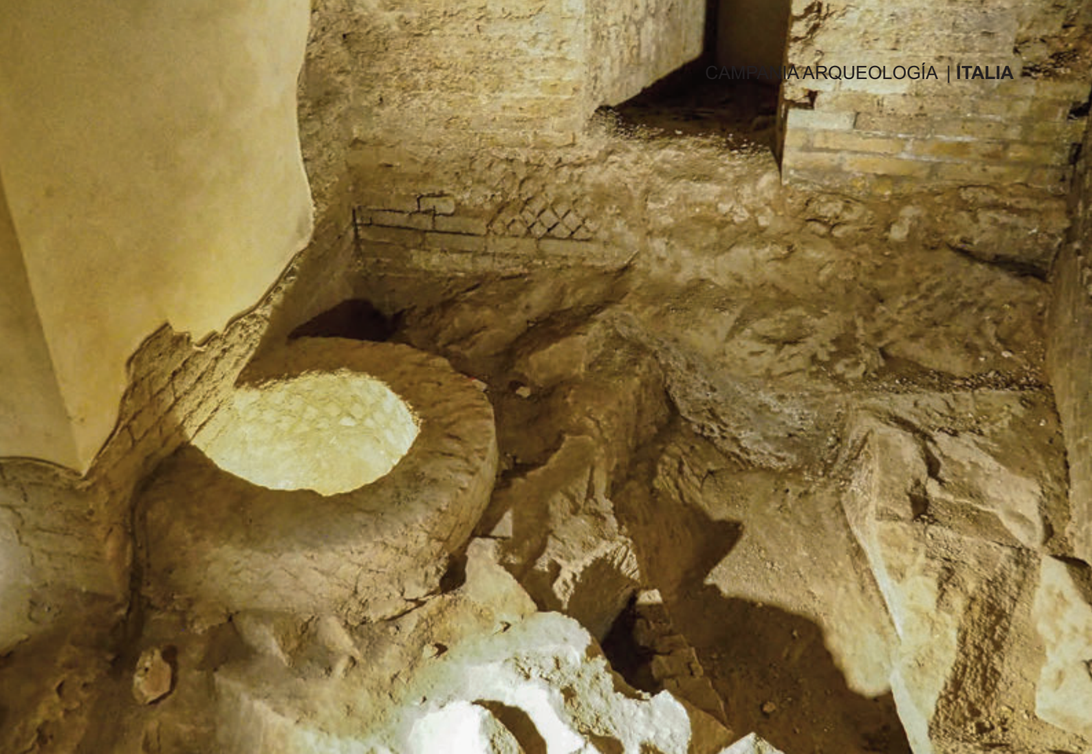
Pozos y cimentaciones con pulvis puteolanis

y las termas. Fue aquí donde nació el cemento. Los ingenieros romanos aprendieron a elaborar hormigón, el pulvis puteolanis , con la puzolana, que es una roca silíceica de origen volcánico - lo podrían haber aprendido de los minoicos, que ya la utilizaban para la construcción.