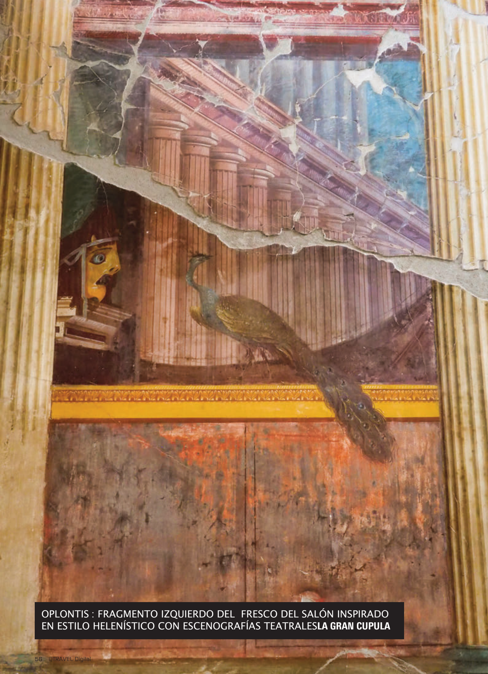
OPLONTIS : FRAGMENTO IZQUIERDO DEL FRESCO DEL SALÓN INSPIRADO EN ESTILO HELENÍSTICO CON ESCENOGRAFÍAS TEATRALES LA GRAN CUPULA