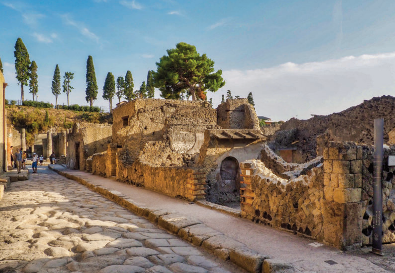
Herculano Decumano Inferior con las fachadas de la casas

fue explorado a través de pozos y túneles subterráneos y siguiendo el recorrido de calles y edificios fue posible recuperar pinturas, mosaicos, esculturas y fragmentos de mármol.