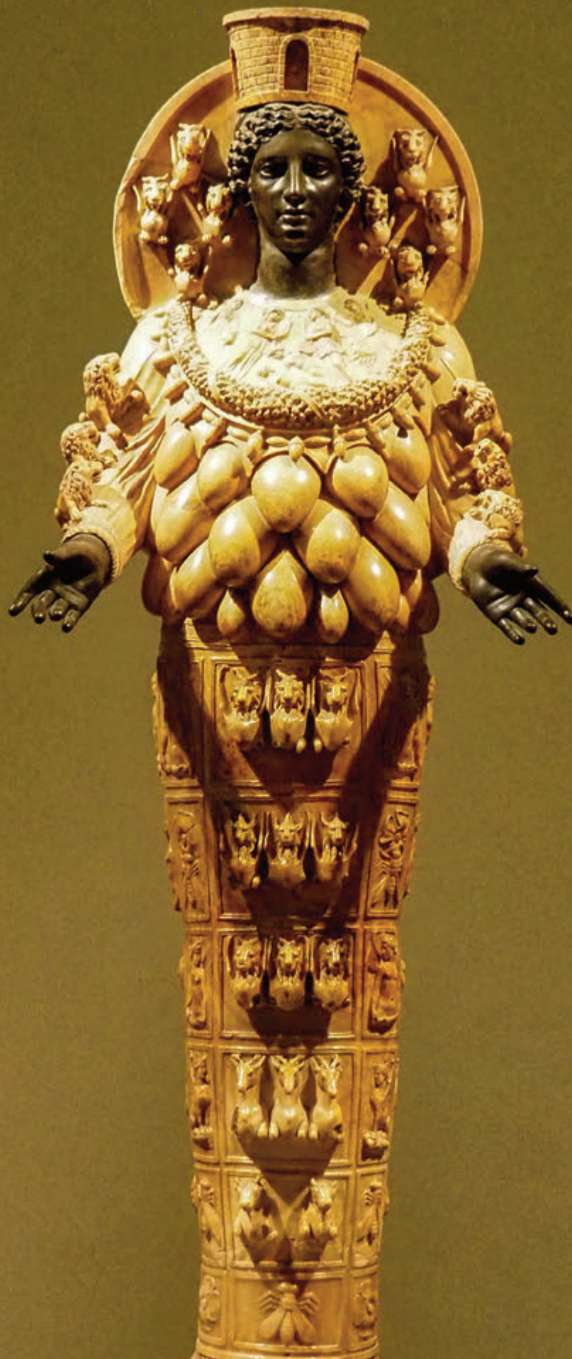
ESCULTURA DE LA DIOSA ARTEMIDE DE EFESOLA GRAN CUPULA DORADA DE LA CATEDRAL DE SAN ISAAC SE PUEDE DIVISAR DESDE CASI CUALQUIER PUNTO DE LA