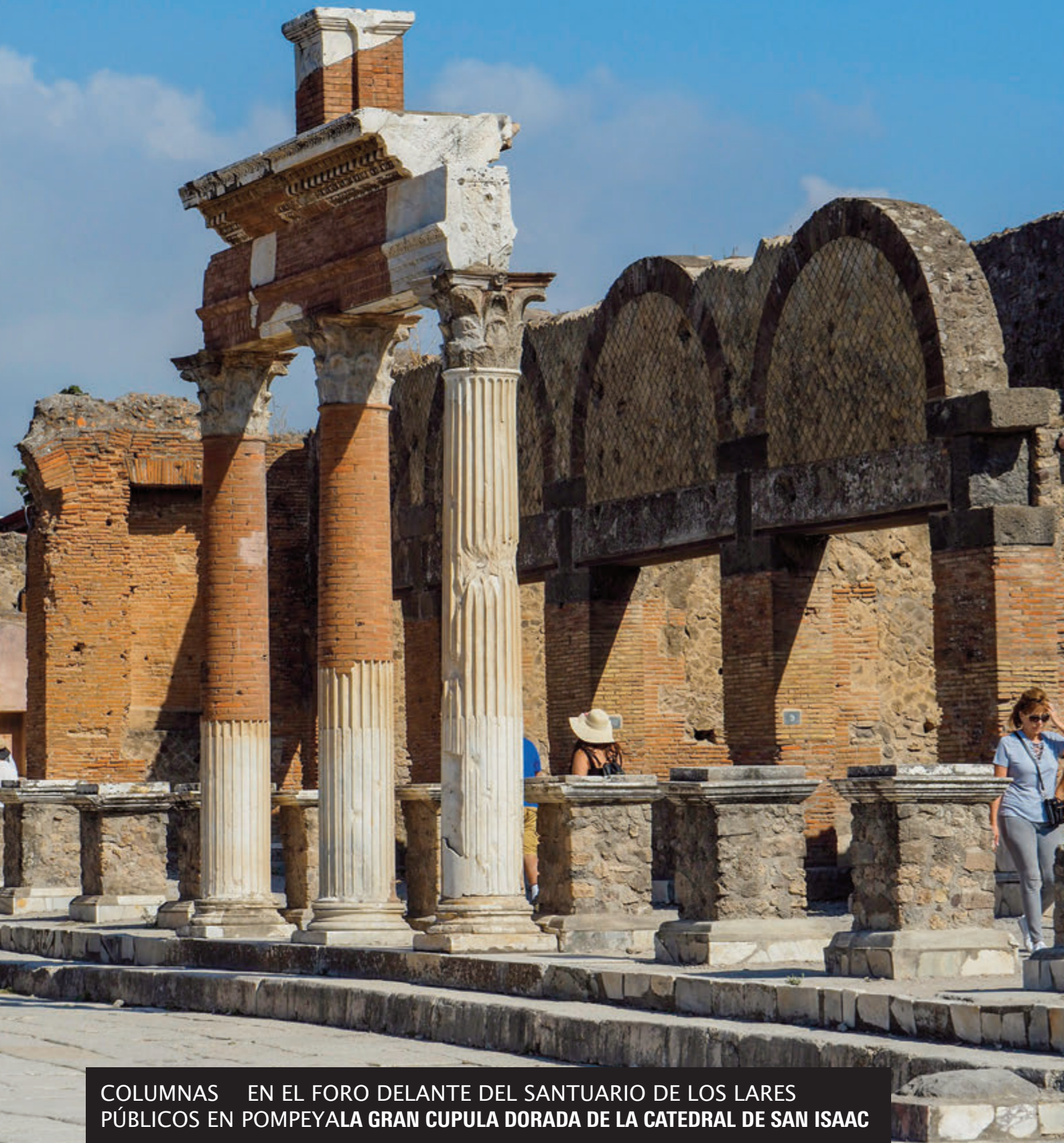
COLUMNAS EN EL FORO DELANTE DEL SANTUARIO DE LOS LARES PÚBLICOS EN POMPEYALA GRAN CUPULA DORADA DE LA CATEDRAL DE SAN ISAAC