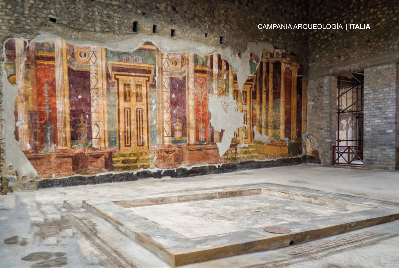
OPLONTIS: ATRIO CON IMPLUVIUM – FRESCOS DE ESTILO POMPEYANO