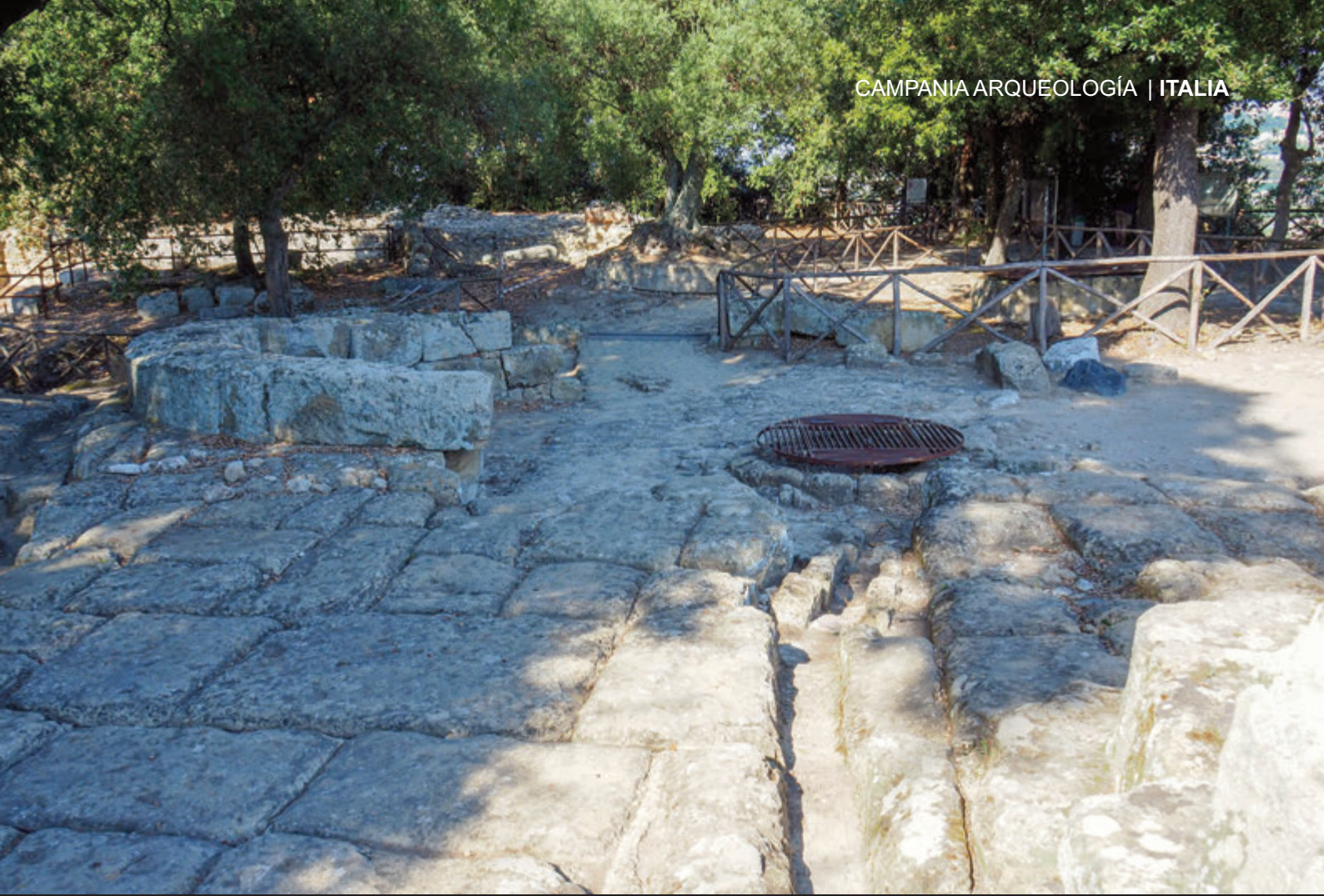
ACCESO AL SANTUARIO DE APOLO EN CUMAS – SISTEMA DE RECOGIDA DE AGUAS PLUVIALES