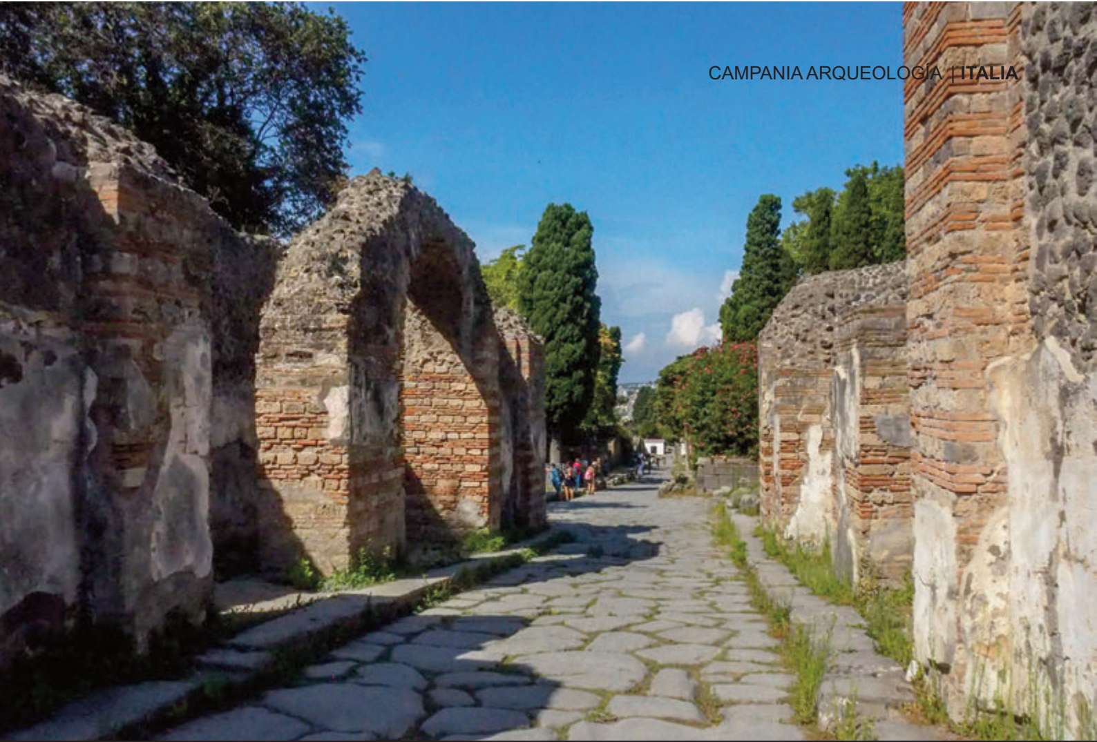
MUROS DE LA PUERTA DE HERCULANO – INFERIOR VILLA DE LOS MISTERIOS