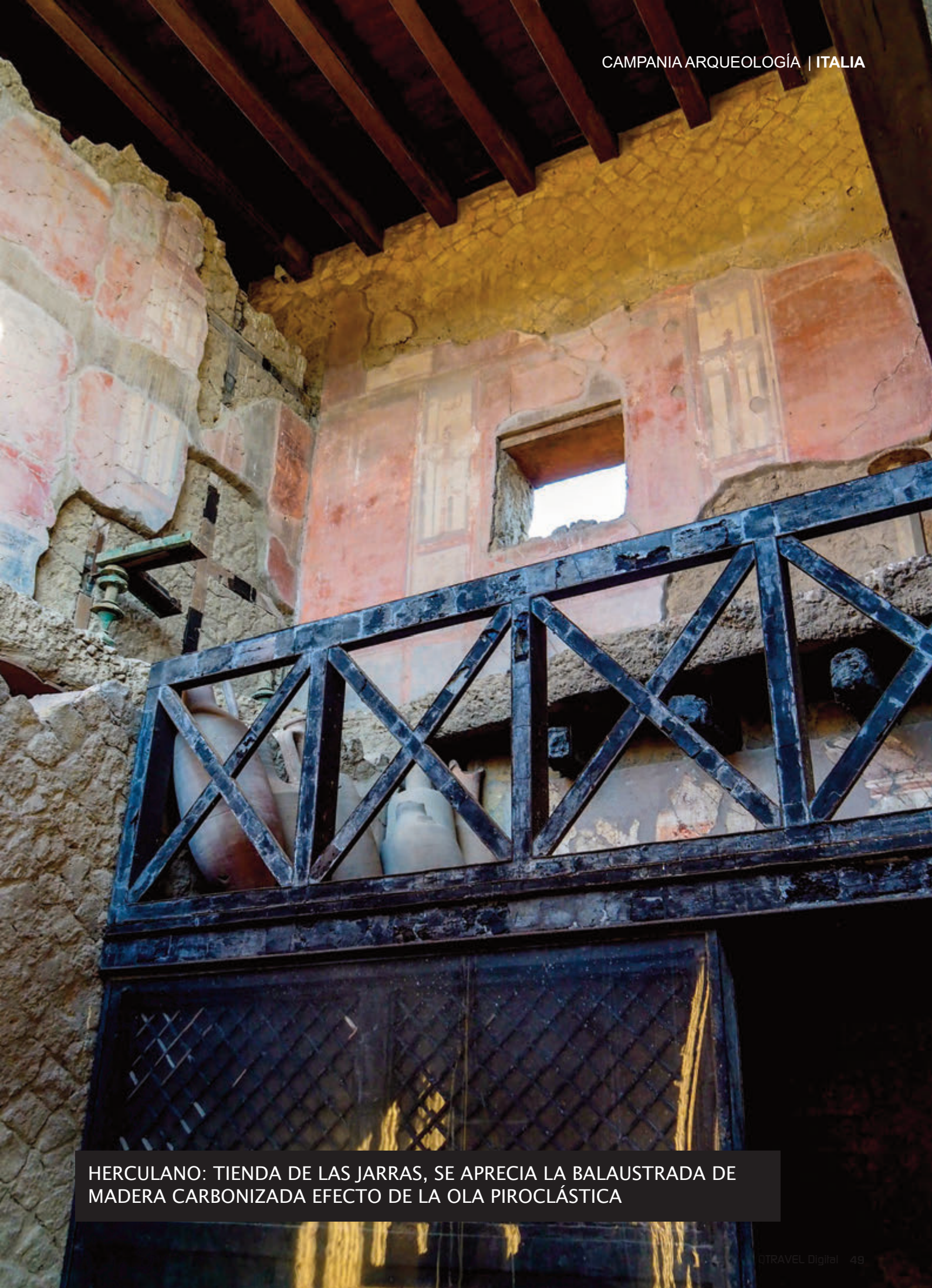
HERCULANO: TIENDA DE LAS JARRAS, SE APRECIA LA BALAUSTRADA DE MADERA CARBONIZADA EFECTO DE LA OLA PIROCLÁSTICA