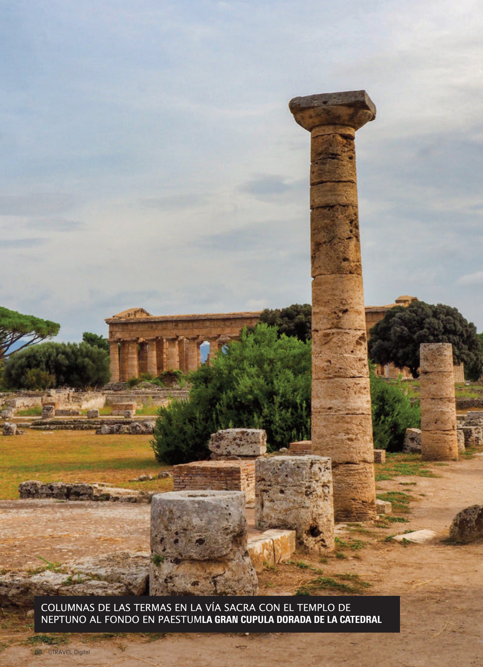
COLUMNAS DE LAS TERMAS EN LA VÍA SACRA CON EL TEMPLO DE NEPTUNO AL FONDO EN PAESTUMLA GRAN CUPULA DORADA DE LA CATEDRAL