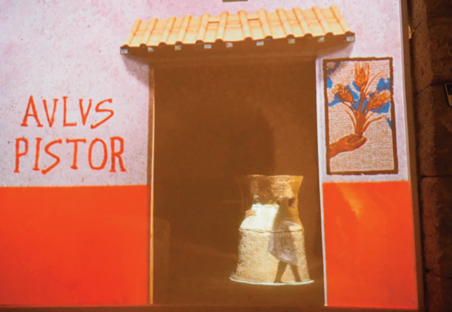
Recreación virtual de Rione Terra