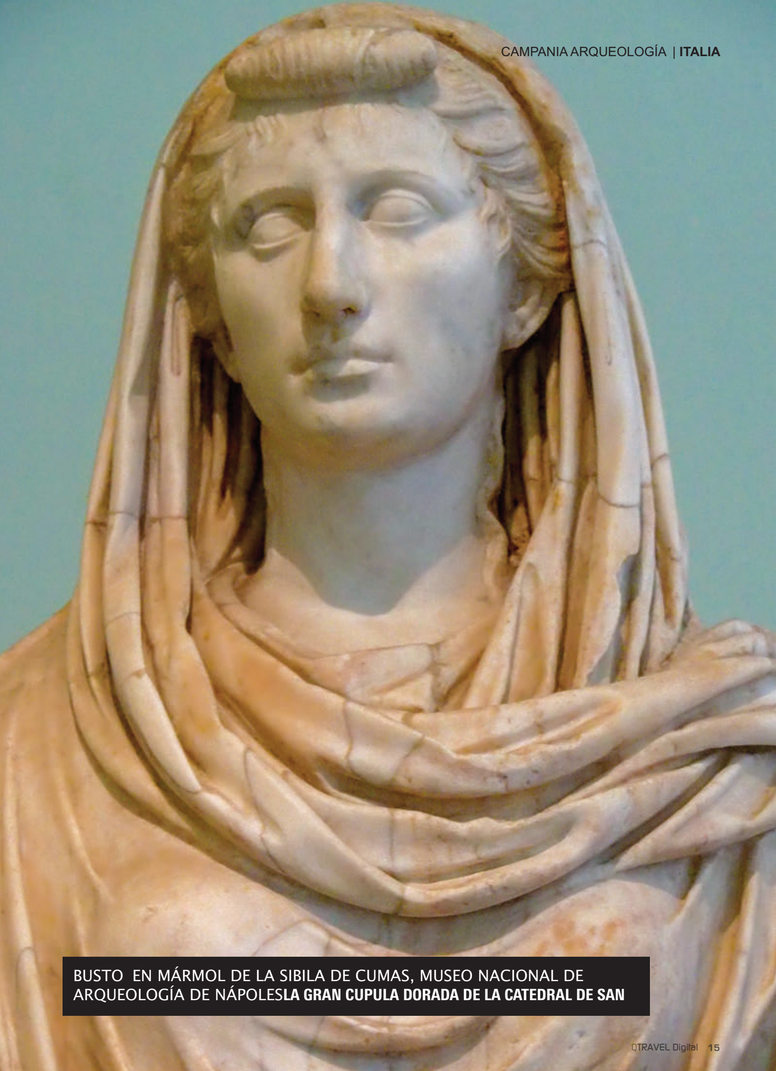
BUSTO EN MÁRMOL DE LA SIBILA DE CUMAS, MUSEO NACIONAL DE ARQUEOLOGÍA DE NÁPOLES LA GRAN CUPULA DORADA DE LA CATEDRAL DE SAN