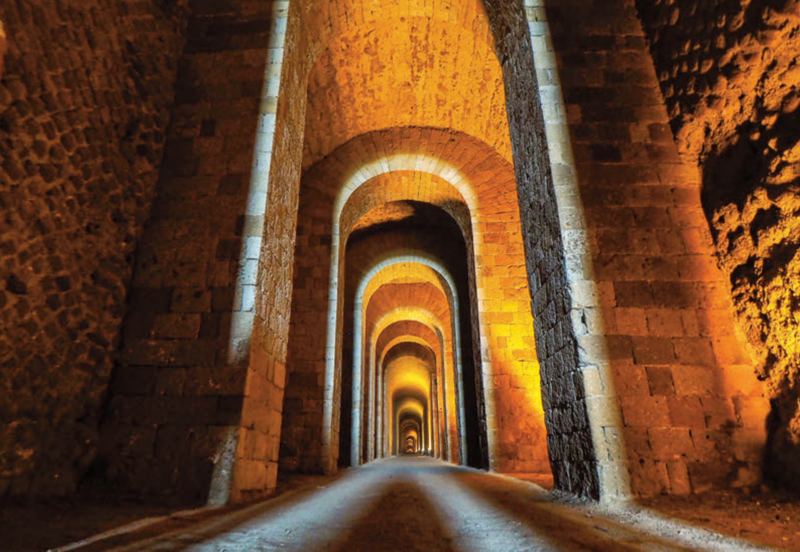
Gruta de Sejano, acceso al recinto de las villas imperiales del parque arqueológico de Pausilypon