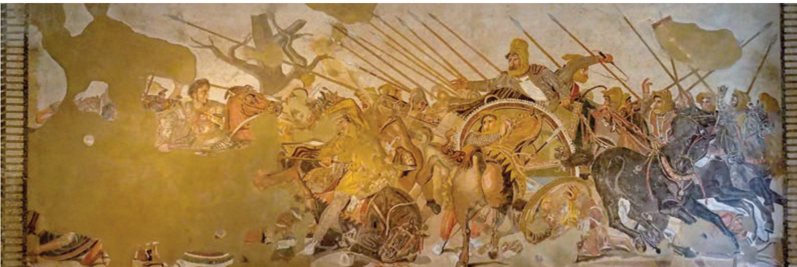
Superior: Cama proveniente del lupanar de Pompeya - inferior: mosaico de Alejandro proveniente de la casa del Fauno, Pompeya

En lo que consideraríamos un entresuelo, encontraremos la colección de mosaicos, procedentes la mayor parte de las excavaciones de Pompeya y Herculano, de los cuales destacan el llamado Memento Mori el mosaico de los Dioscuros que procede de la villa de Cicerón en Pompeya, el gran mosaico incompleto de