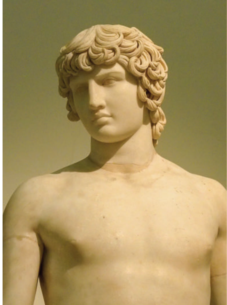
BUSTO DEL EMPERADOR ADRIANO Y BUSTO DE ANTINOO- FRESCOS POMPEYANOS